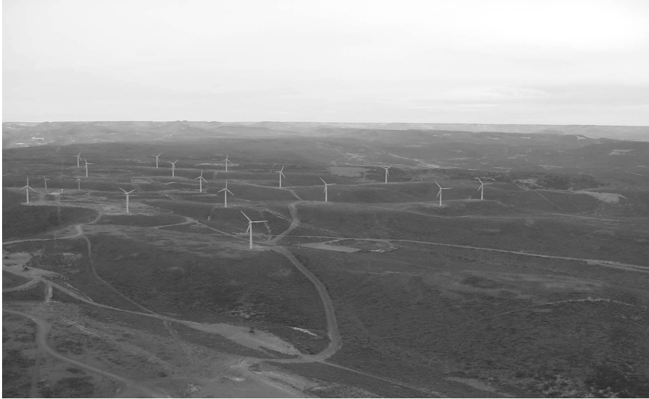
Figura 2: Fotografía aérea de los aerogeneradores ubicados sobre el C° Arenales.

La Figura 2 muestra una fotografía del C° Arenales y los 18 aerogeneradores. A partir de esta imagen se calcularon los factores antes mencionados.