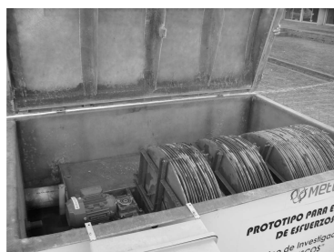
Figura 1: Planta compacta de tratamiento de líquidos residuales en la UCC

Se analizó un líquido residual proveniente de un sector del Campus de la UCC, camino a Alta Gracia km 7 ½, correspondiente a tres facultades y un bar/comedor adaptándose el caudal de entrada a la planta compacta de tratamiento (Figura 1), para que sea equivalente al producido por 25 personas de consumo estándar (200 L por persona por día).