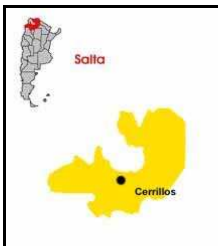
Figura 1: Ubicación de la localidad de Cerrillos de la provincia de Salta en Argentina.

Los bajos ingresos provienen de la condición laboral rural de la población, concentrada en las tareas rurales de las fincas/chacras de la zona (tabaco, hortaliza) y en menor medida son empleados en la Municipalidad, el Hospital, el comercio. En medio de tales condiciones sociales, la escuela continúa siendo un foco importante de irradiación de pautas de formación de la niñez y la juventud en este tipo de localidad rural (Davini, 2009).