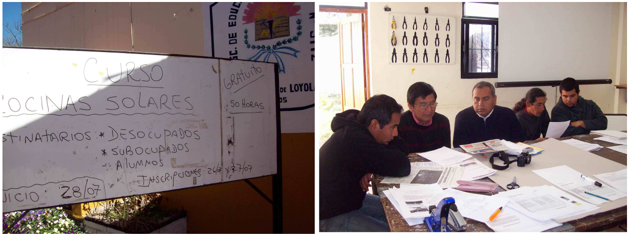
Figura 1: Difusión del curso a la entrada del a EET y asistentes al primer dictado desarrollando las actividades propuestas

De este fundamento inicial de la Capacitación/Acción Formativa elevada ante el INET y aprobada, se mantiene la mayor parte de la población meta. Efectivamente se trata de una acción formativa que atrae a las mujeres que enseñan gastronomía en la escuela y a alumnos/as de estos cursos; a los técnicos profesores porque implica la concurrencia de saberes conceptuales y procedimentales en un área que les compete para asegurar o ampliar su enseñanza; y a la población en condiciones de cierta precariedad laboral dado la oferta de capacitación que incluye. En todos los casos se trata de asistentes concurrentes de la localidad de Cerrillos o del centro de la ciudad de Salta, antoiciados por la propaganda escolar voz a voz o a través del noticiero de cable que divulga la noticia (figura 1).