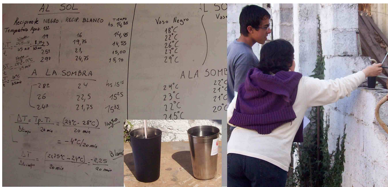
Figura 3: Experiencia de radiación

Las experiencias propuestas consisten en observar la convección en un tubo de ensayo con agua y hielo y en determinar la tasa de calentamiento/enfriamiento de un vaso negro y un vaso plateado (figura 3).