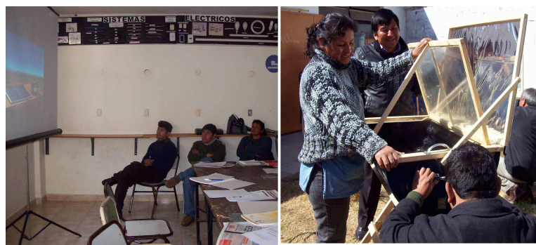
Figura 3: El curso CS dictado con al metodología de multiambiente de aprendizaje.

Se propone como espacio de aprendizaje el multiambiente de aprendizaje que incluye el uso de material multimedial, prácticas sencillas, clases explicativas con el propósito de favorecer el aprendizaje significativo de los estudiantes. Se trata de una integración que propicia una mayor interacción profesor – alumno y alumno – alumno, una construcción del conocimiento a través del procesamiento de información por medio de varias formas simultáneas de lenguajes (figura 3). Brito Leão propone que esta nueva sala de clases sea dinámica, multisensorial, a partir de la utilización de videos, la pc y equipos experimentales. En este planteo, el docente debe poner en juego capacidades diferentes a las habituales (Brito Leão, 2006).