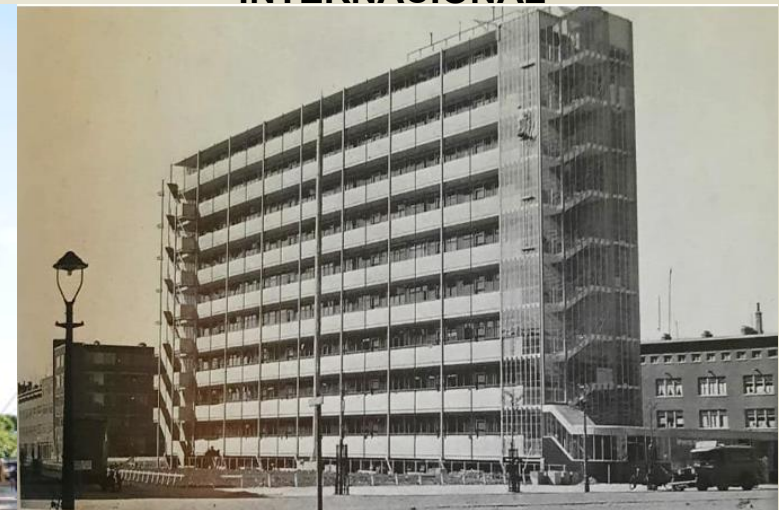
Edificio Bergporlder (1933-34) Rotterdam - Holanda