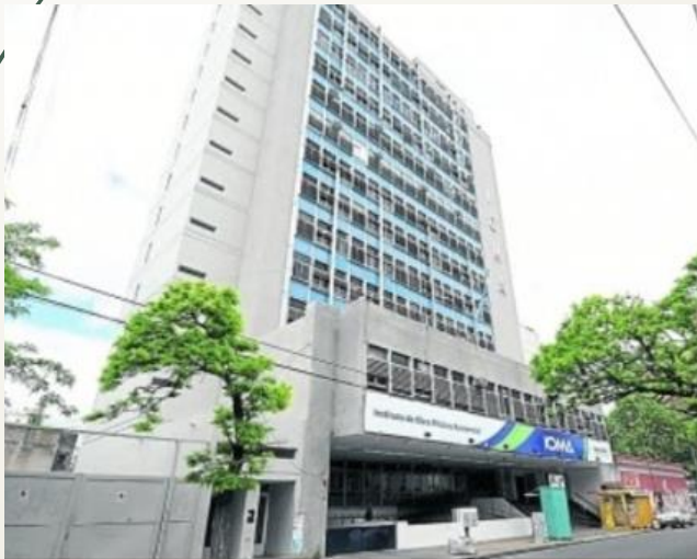
Sede de IOMA, 46 el 12 y 13. (Dirección de Arquitectura MOP. 1966/70)