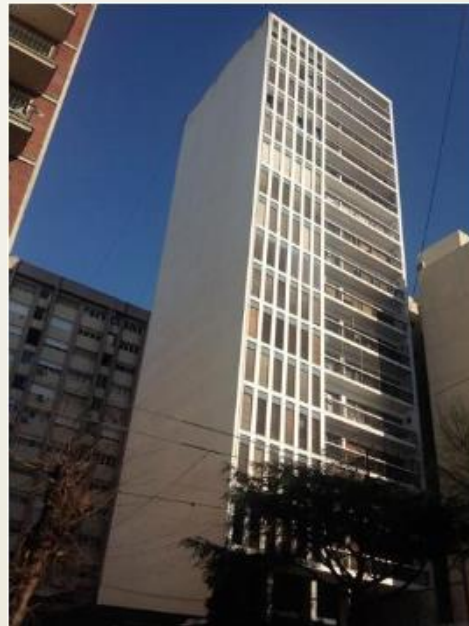
45 e/6 y 7 Arqs Chel Negrin/Fornari, 1964