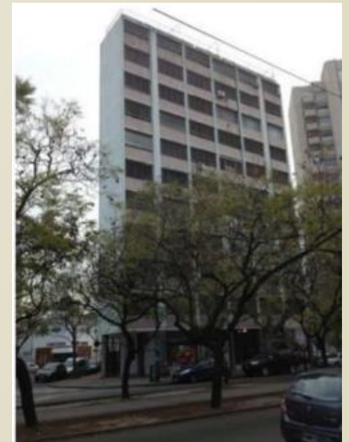
Diag. 74 y esq. 11 D. Almeida, 1956.