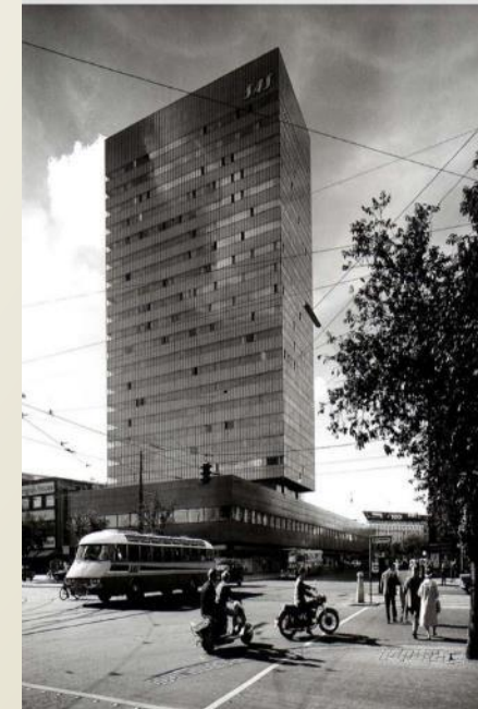
Royal SAS (1961), Copenhague