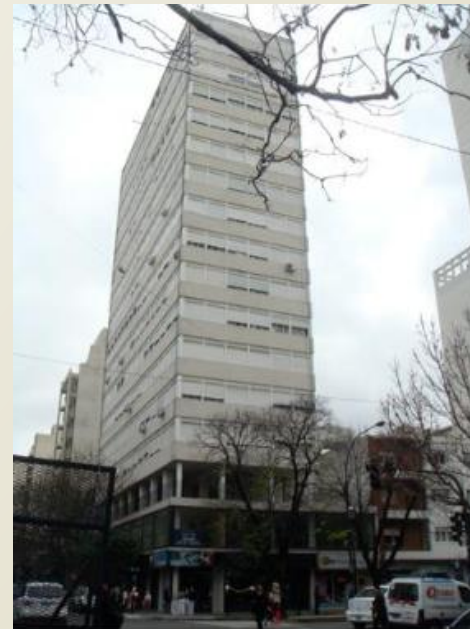
Av. 7 esq. 55 Arq. Gómez Destrade, 1958