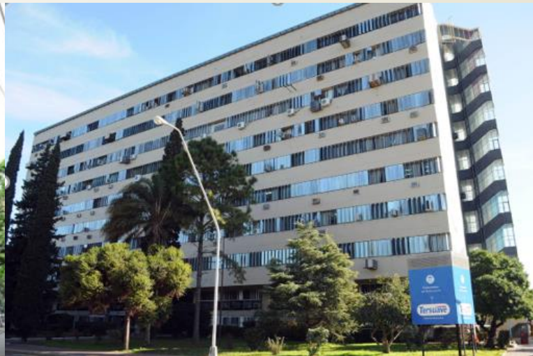
Ministerio de Educación Santa Fé