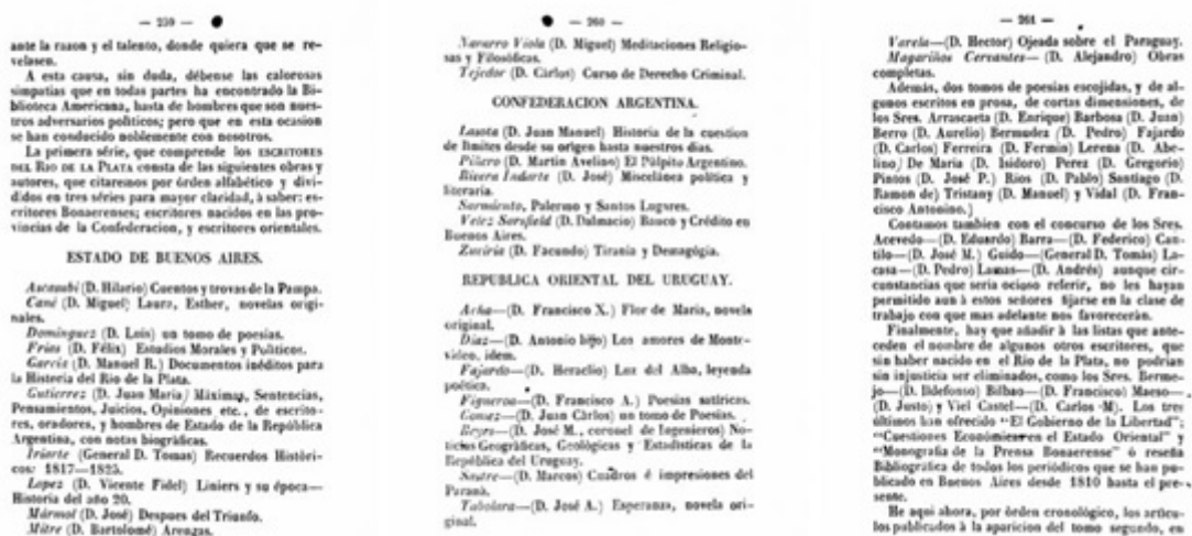
Figura 5. Propuesta de obras y autores.