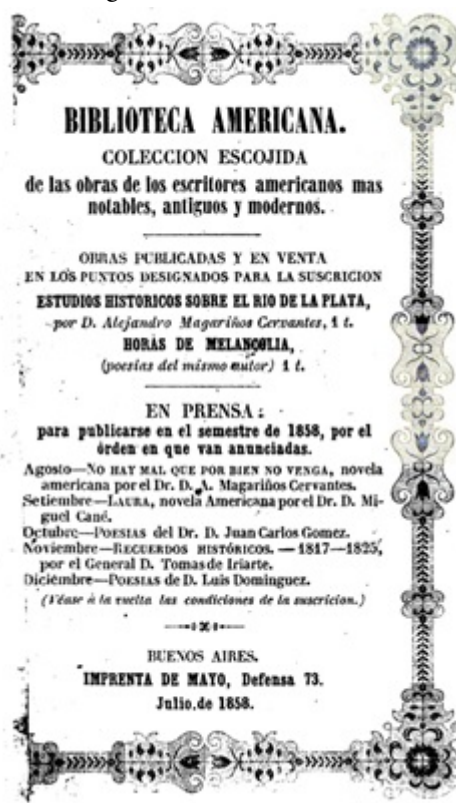
Figura 4. Obras a editarse