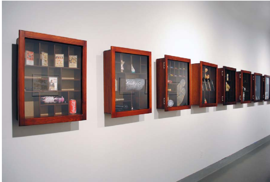
Figura 1. Fragmentos de Oposición al Olvido (2012), de Olga Guerra. Instalación de arte objeto. Vitrinas de 50 x 65 cm.

En esta obra, la artista intenta que el espectador deje de ver a las víctimas como ajenas «como un ente aislado, lejano, irreconocible más que en lo efímero de la nota roja o las cifras que los medios imponen», ya que por medio de los objetos expuestos genera «vínculos de identidad; es decir, aquello que se exhibe en las vitrinas es algo que “yo también uso”. La obra permite un acercamiento a la muerte violenta desde lo humano, lo común» (O. Guerra, comunicación personal, 23 de septiembre de 2015). Asimismo, a través de la exposición de estas diez vitrinas, la autora busca construir espacios concretos que permitan la interrelación y el diálogo entre diferentes sujetos de la realidad juarense, desde los familiares directos de los desaparecidos o fallecidos, hasta la comunidad en general.