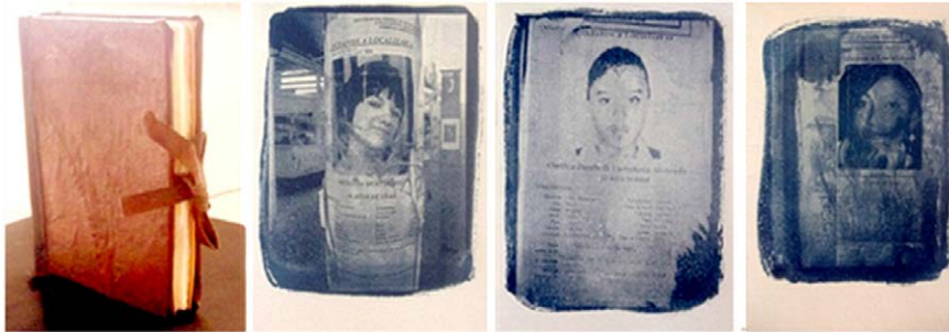
Figura 5. Sin Título (2012), de Olga Guerra. Libro de artista. Cianotipias. Dimensiones: 19 x 13 cm.

Durante el período de violencia derivada de la «guerra contra el narcotráfico» en Ciudad Juárez, las noticias que más resaltaron fueron aquellas que se les relacionaba directamente con venganzas o luchas entre carteles de la droga, extorción, secuestro, asalto, masacres, etcétera. Sin embargo, la ciudad empezó a tapizarse día a día de pesquisas que casi nadie percibía. Las estadísticas de niñas y mujeres desaparecidas incrementaron hasta duplicar el número de mujeres desaparecidas en los noventas (Guerra, comunicación personal, 23 de septiembre de 2015).