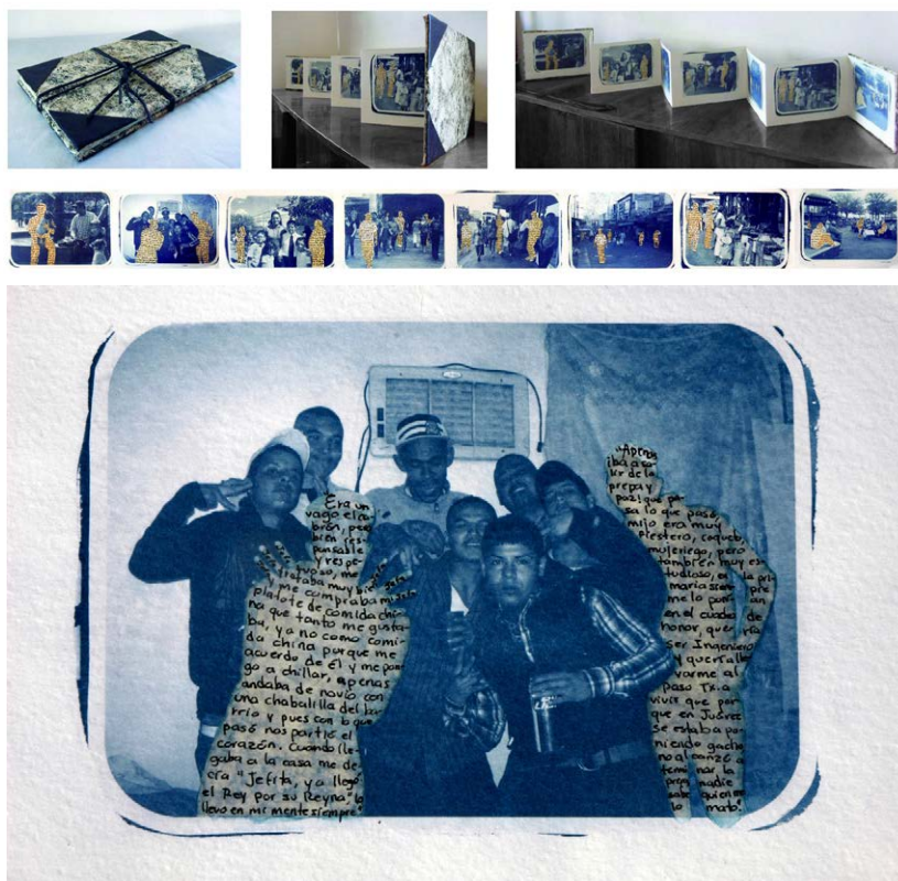
Figuras 3 y 4. Memorias de lo privado a lo político (2013), de Olga Guerra. Libro de artista. Cianotipias y collage.

Pero también, un lugar para exhortar el acto de la lectura; al cabo, un acto de conmemoración en sí mismo, una estrategia, un anclaje que, desde el pasado, nos invita a contextualizar e interpretar la obra en sentido anacrónico (Mínguez-García, 2018, p. 537).