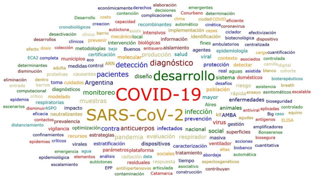
Figura 2. Nube de palabras de títulos de proyectos seleccionados. El tamaño de las palabras resulta de la cantidad de repeticiones en los títulos. La figura presenta aquellas que aparecen al menos dos veces.

La siguiente nube de palabras (Figura 2) se trabajó con los títulos de los 64 proyectos seleccionados y se presentan aquellas palabras con más de dos repeticiones. Se destacan 30 apariciones del concepto COVID-19; 27 veces SARS-CoV2; 20 desarrollo; 9 diagnóstico; 7 detección y pacientes; 6 infección y monitoreo; 5 anticuerpos, Argentina, muestras y pandemia; 4 diseño, evaluación, producción, respirador, social y virus.