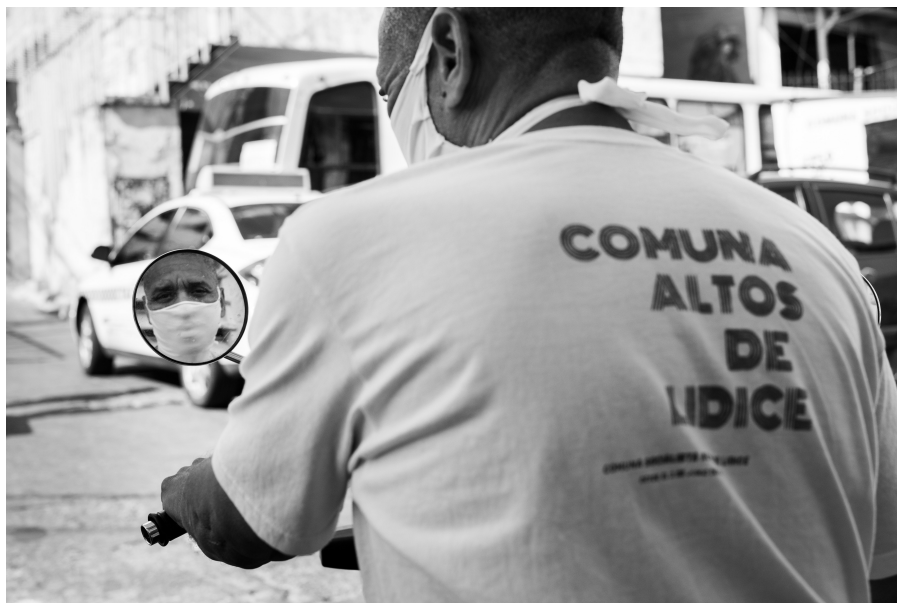
Comuna Altos de Lidice

Pareciera un plan maquiavélico, un juego de resistencia. Un día empezó la guerra con los alimentos al mejor estilo de Chile en los años 70. La guerra alimenticia no funcionó, ahora vamos por las medicinas. No funcionó con las medicinas ahora vamos con las sanciones. No funcionan las sanciones, ahora intensifiquemos el bloqueo. Ya no es el bloqueo, ahora vamos por el servicio eléctrico. Ya no es el servicio eléctrico, ahora vamos por el agua. Ya no es el agua, ahora es la gasolina. Mecanismos de respuesta abundan, no sólo en el gobierno, está también en los ciudadanos de a pie como la señora que carga la bombona de gas hasta su casa, el señor que vende los cigarros en la plaza, el que se levanta a las 4:00 am para agarrar el primer metro, el pescador que cuida sus mares. Esa es la respuesta combativa y que no se doblega. Es el sector de mugrientos y pobres para los malignos. Con esas personas no contaban los mercenarios que entraron en aquellos mares, a sus espaldas traían los horrores de Irak y Afganistán que intentaron traer hasta Venezuela. La respuesta fue contundente ¡No pasarán!.