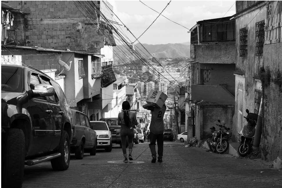
Comuna Altos de Lídice

Esta obra está bajo una Licencia Creative Commons Atribución-NoComercial-Compartir Igual 4.0 Internacional