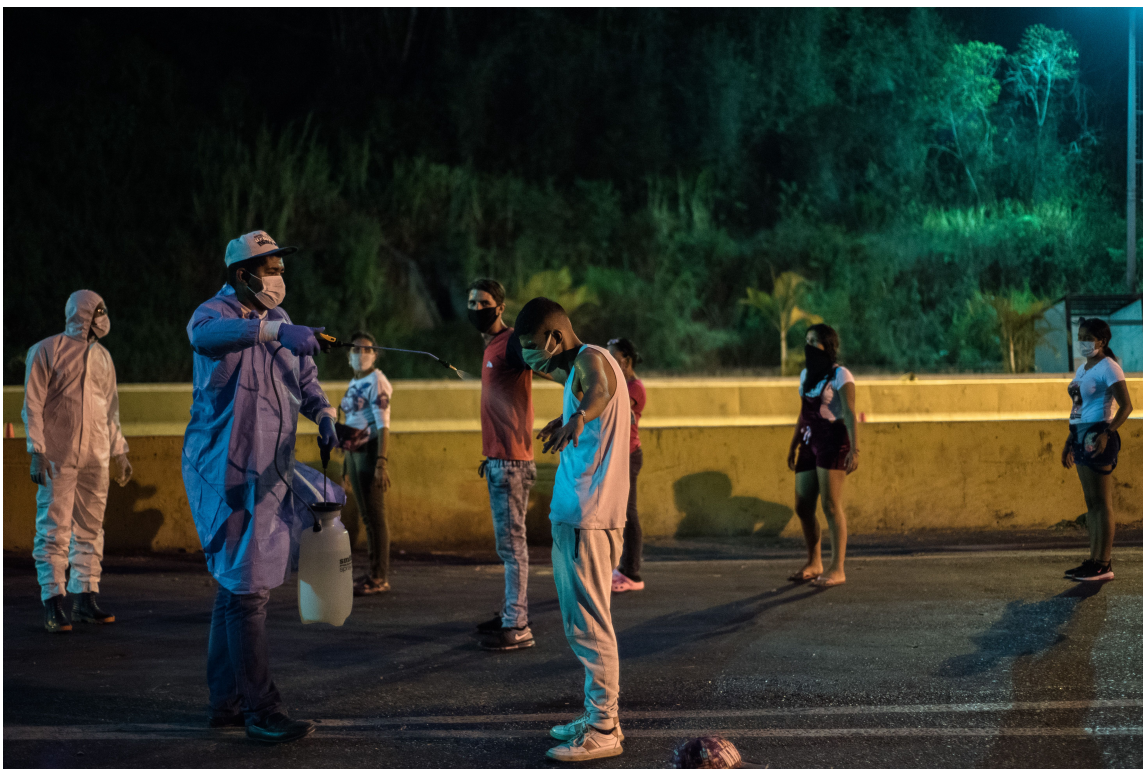
Ciudadanos venezolanos provenientes de Colombia a la ciudad de Caracas.

Hoy en medio de la pandemia por la COVID-19, son miles los venezolanos en los puntos fronterizos que regresaron caminando desde muchos países latinoamericanos. Otros regresan en vuelos humanitarios pagados por el gobierno bolivariano. Se les garantiza comida, atención médica y después de dos semanas de aislamiento preventivo transporte hasta sus hogares. Muchos se fueron maldiciendo a este país. Hoy regresan y su tierra los abraza.