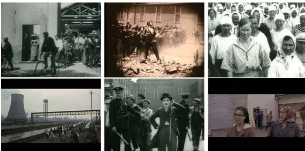
Figura 2. Workers Leaving the Factory in Eleven Decades (2006) , de Harun Farocki. Diapositiva. Instalación, video 36 minutos. Fundación Proa, Exhibición Harun Farocki, del 2 de febrero al 7 de abril de 2013, sala 2

Las operaciones de juntura a través del montaje blando forman parte del modus operandi con el que Farocki se acerca al arte instalativo de modo tangencial. Según él «un montaje debe unir con fuerzas invisibles los componentes que, de otra forma, se dispersarían» (Farocki, 2013, p. 119). La sintaxis propia que anhelaba para su nueva retórica en espacios de arte, las nuevas combinatorias expresivas y las funciones que ellas cumplen en cada instalación ayudan a evitar la univocidad de sentido sin prejuicio de la claridad —como él mismo dice—. Los monitores (dos o los que fuere) no están en estas instalaciones solo para significarse a sí mismo, son sintagmas cuidadosamente compuestos para forzar un ejercicio atento de la escucha y de la mirada del espectador. Son signos, si se quiere, del desmontaje de los dispositivos de imágenes [Figura 2].