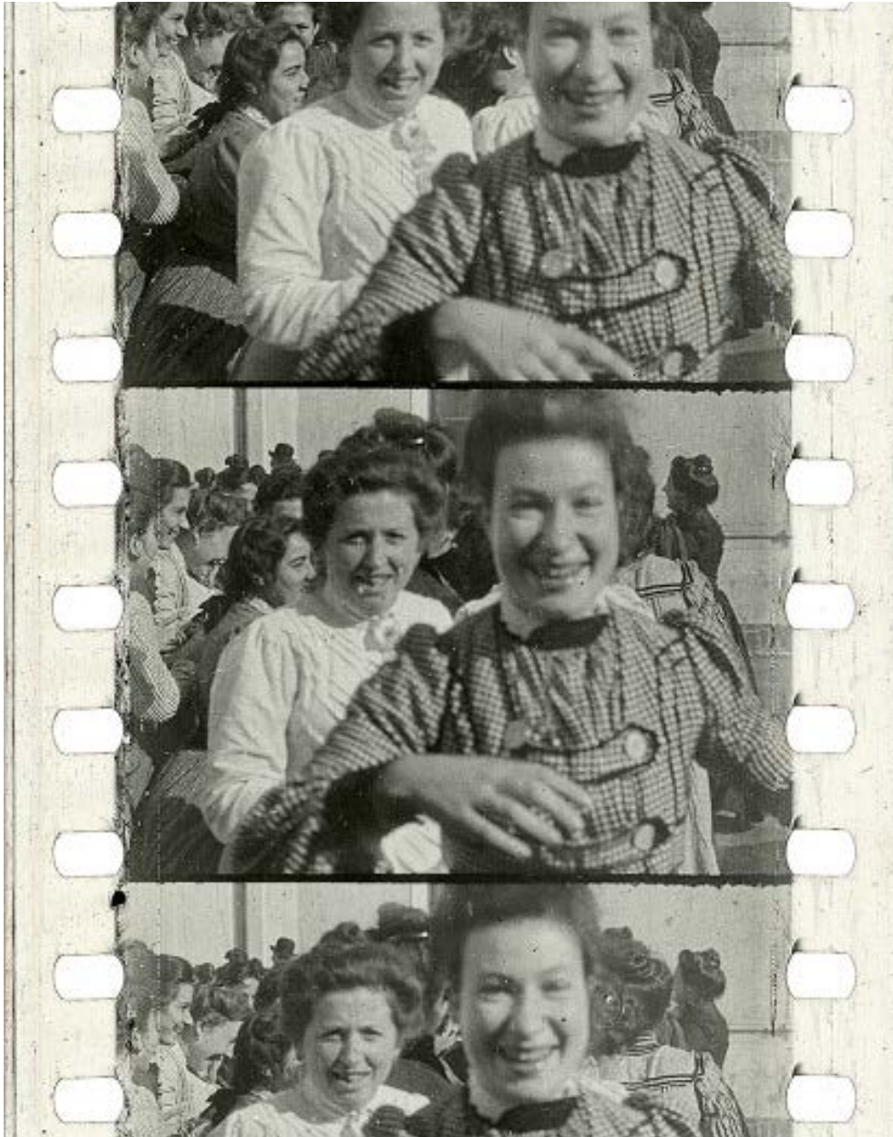
Figura 1. Salida de la fábrica de cigarrillos La sin bombo, Argentina (1904-11). Imagen de la portada del libro y reproducción de fotogramas (p. 24): Nitrato argentino. Una historia del cine de los primeros tiempos (2019)

En blanco y negro, y desde la portada del libro, las mujeres de la fábrica de cigarrillos y tabaco La sin bombo bailan frente a cámara [Figura 1]. En color rosa se lee: «Nitrato argentino. Una historia del cine de los primeros tiempos». Ya en 1904 el cine era una fiesta y un motivo de copia. Las trabajadoras sonríen a la salida de la fábrica, incluso después de la jornada de trabajo. Mientras tanto, las mujeres de los comienzos del cine aguardan su lugar en la historia.