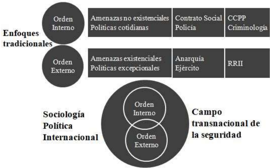
Figura 1. La ruptura entre el orden interno y el orden internacional.