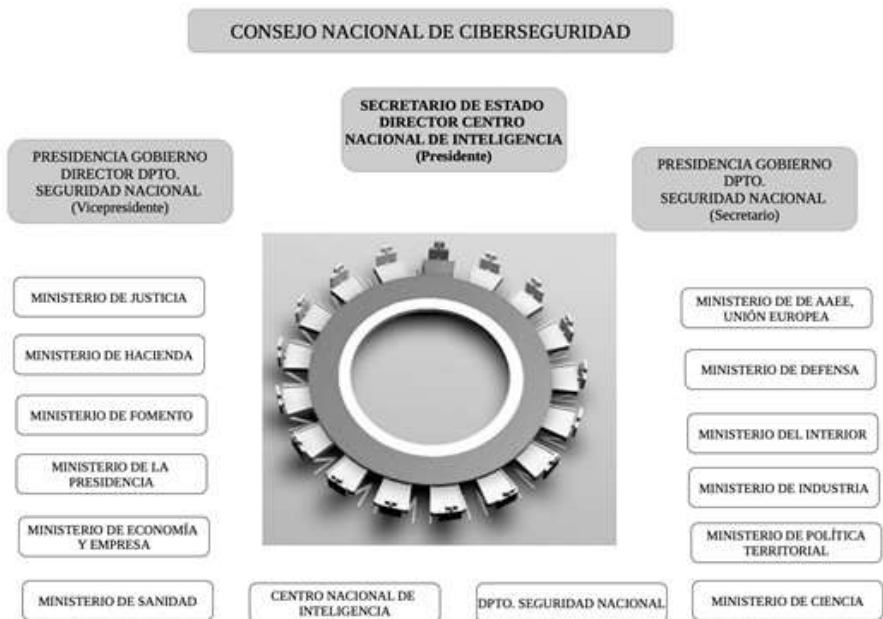
Figura 3. Composición del Consejo Nacional de Ciberseguridad

La segunda de sus funciones es la de asistencia (además de al Consejo Nacional de Seguridad Marítima, Comité de Situación para la gestión de crisis, Comité Especializado de Inmigración, Comité Especializado de No Proliferación y Comité Especializado de Seguridad Energética) al Consejo Nacional de Ciberseguridad (CNC) (figura 3).