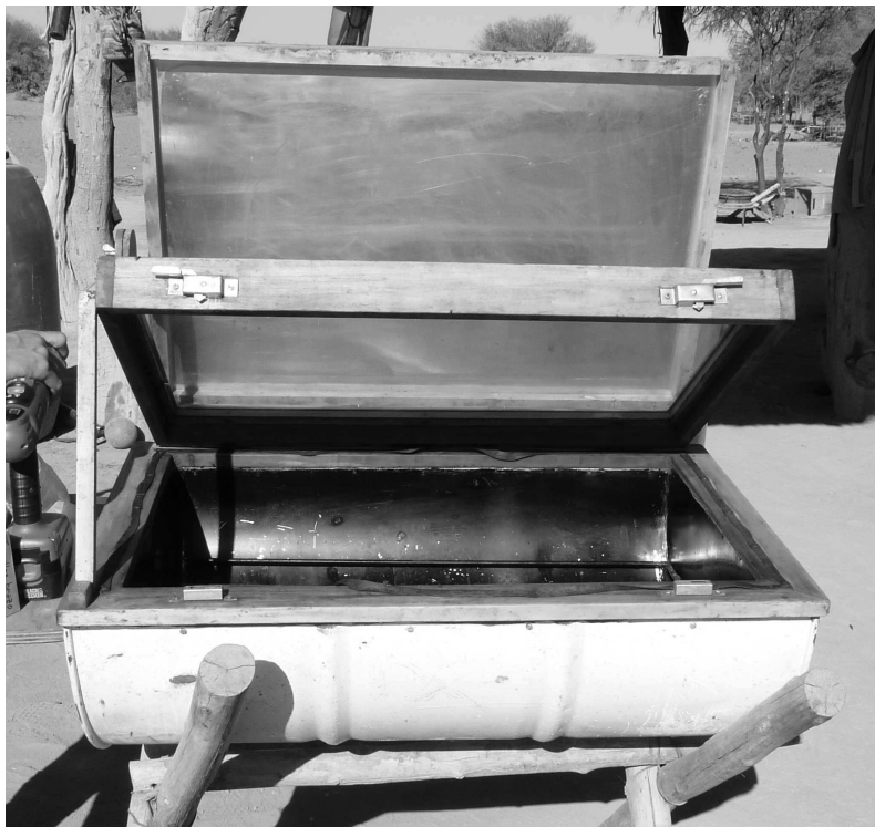
Imagen N° 2: Horno solar de tacho.

socio-técnica de los dispositivos solares. En primer lugar, en el proceso de instalación inicial de los artefactos fue construyéndose un cierto nivel de funcionamiento y adecuación, sustentado en el involucramiento de nuevos actores en una alianza socio-técnica más estable. La selección conjunta de los usuarios, el acceso a los espacios necesarios para el ensayo de los equipos, el intercambio de información sobre el rendimiento de los destiladores y el ajuste de los diseños, entre otros, fueron elementos que contribuyeron a la estabilización del artefacto.