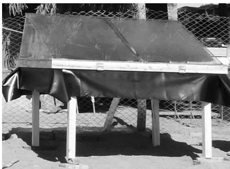
Imagen N° 1: Destilador solar asimétrico.

En principio, los resultados parecieron encaminarse en esa dirección, en cada uno de los tres puestos elegidos en primer lugar, quedaron instalados y operando un destilador solar (Imagen N° 1) y un horno solar (Imagen N° 2). Los investigadores habían proyectado instalar posteriormente los dispositivos acordando con los usuarios en función de las necesidades que manifestaran. Los pobladores podían optar por tener un destilador y un horno o ambos, según el caso.