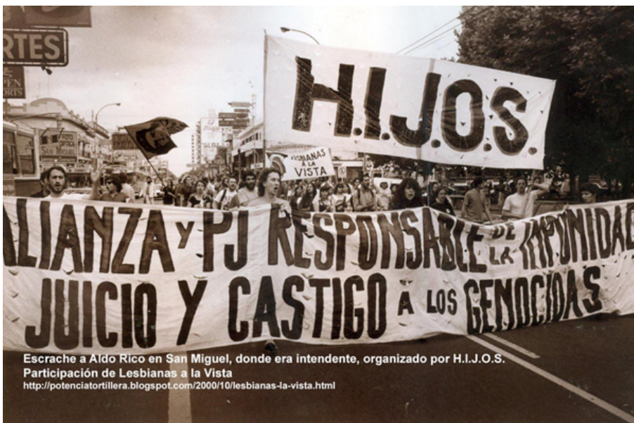
Escrache a Aldo Rico en San Miguel, donde era intendente, organizado por H.I.J.O.S. Participación de Lesbianas a la Vista http://potenciatortillera.blogspot.com/2000/10/lesbianas-la-vista.html