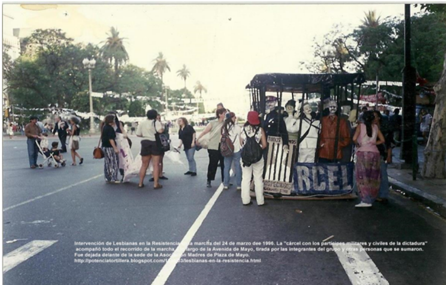
Intervención de Lesbianas en la Resistencia en la marcha del 24 de marzo del 1996. La "cárcel con los prisioneros militares y civiles de la dictadura" acompañó todo el recorrido de la marcha a cargo de la Avenida de Mayo, tirada por las integrantes del grupo y otras personas que se sumaron. Fue dejada delante de la sede de la Asociación Madres de Plaza de Mayo. http://potenciatortillera.blogspot.com/2009/03/lesbianas-en-la-resistencia.html