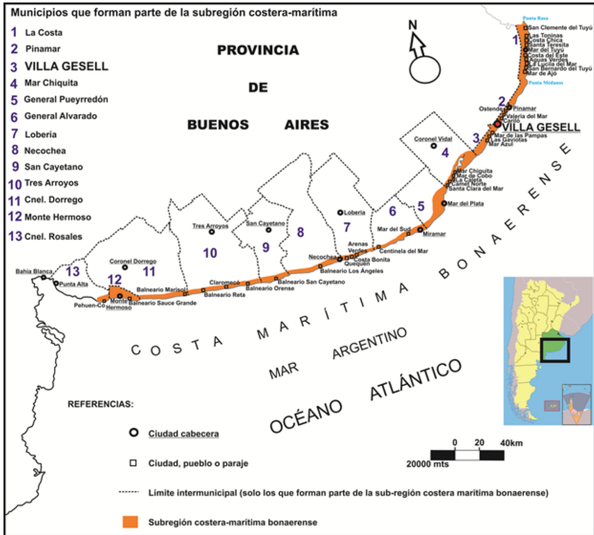
FIGURA 1. Localización de Villa Gesell en la Subregión costera marítima bonaerense.