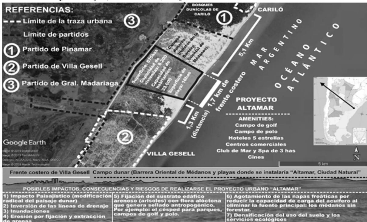
FIGURA 2 Infografía del proyecto Altamar y sus posibles consecuencias socioambientales.