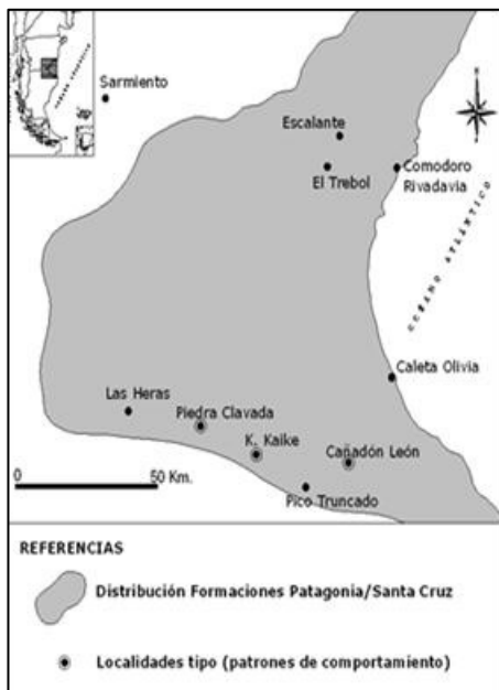
Figura 1. Ubicación de la zona (modificado de Paredes, 2002).

Comienza fundamentalmente en el sector oriental de la cuenca del Golfo San Jorge (Figura 1) y a propósito de la legislación aludida, a manifestarse la diferencia de criterios respecto a los conceptos de Formación Patagonia y acuífero "Patagoniano" que motiva esta contribución.