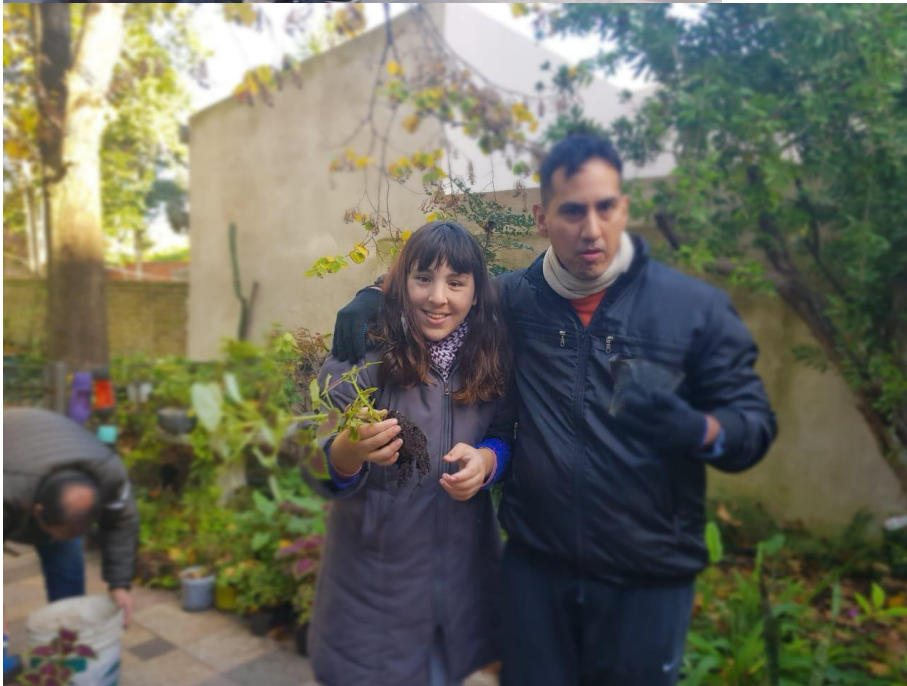
Figuras 4.C. Actividades desarrolladas por el Grupo de Huerta y Jardinería Avanzada