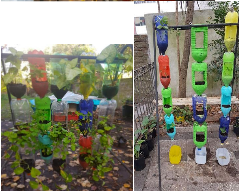
Figuras 4.A. Actividades desarrolladas por el Grupo de Huerta y Jardinería