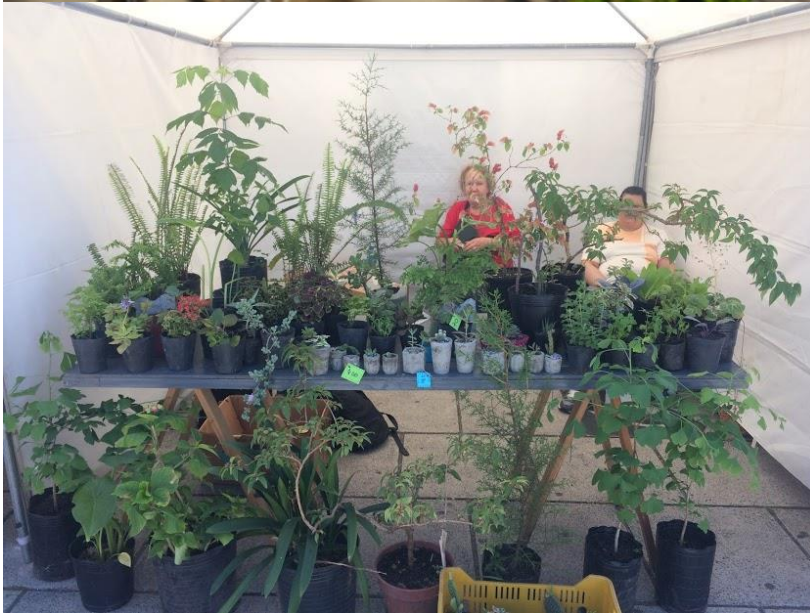
Figura 2. VIVERO DE ATENCION AL PÚBLICO