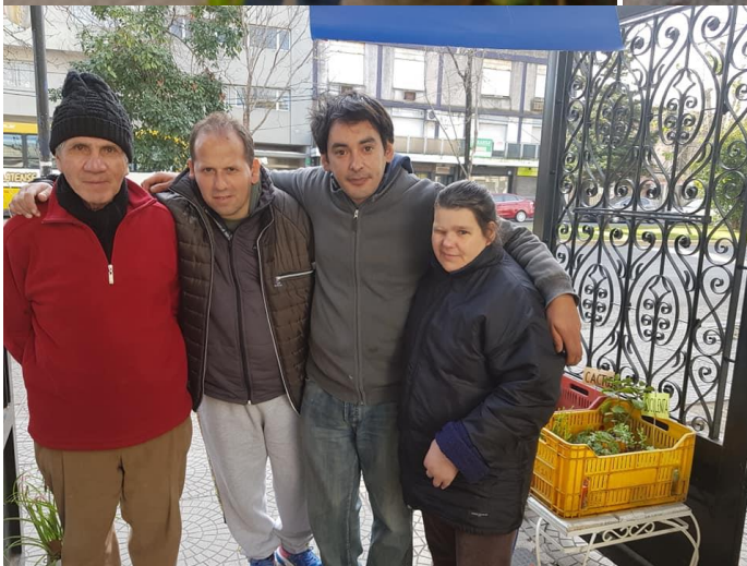
Figuras 5 B. Grupo de atención al cliente y limpieza