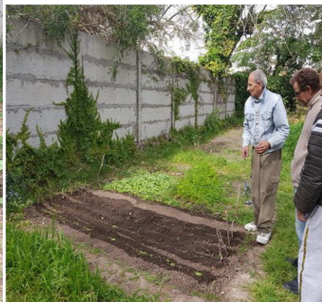
Figuras 3: Actividades desarrolladas por el grupo de Huerta y Jardinería Básica