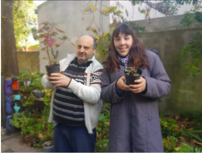
Figuras 4.B. Actividades desarrolladas por el Grupo de Huerta y Jardinería Avanzada