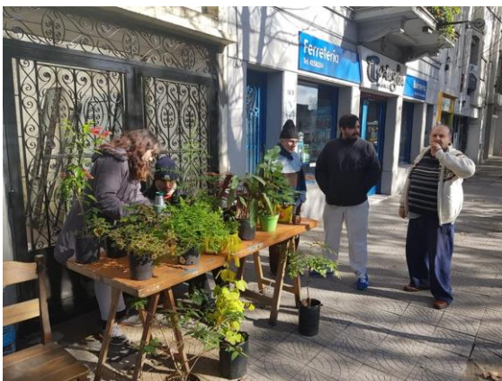
Figuras 5 A. Grupo de atención al cliente y limpieza