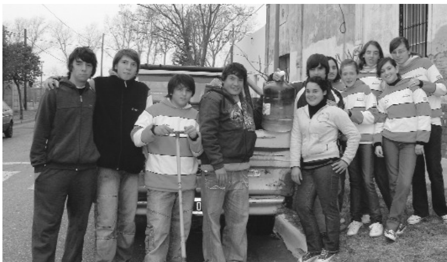
Figura 3. Equipo de ósmosis inversa, tanque de acopio de agua tratada y tarea de distribución