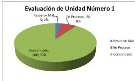
Gráfico 1: Evaluación de Unidad Número 1.

De un total de 200 (doscientos) alumnos, se observa que 180 (ciento ochenta) alumnos tienen conocimientos consolidados con un porcentaje de 90%. 15 (quince) alumnos se encuentran en proceso con un porcentaje del 8% y 5 (cinco) alumnos resuelven mal con un porcentaje del 2%.