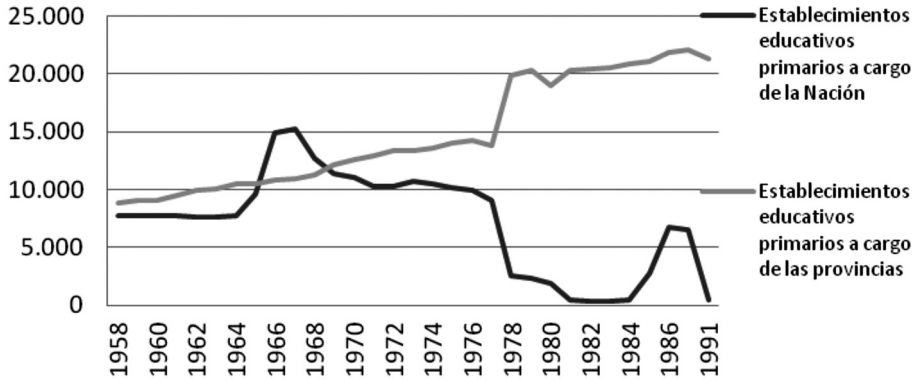
Gráfico 1. Argentina. Evolución de establecimientos por autoridad. Nivel Primario. Años: 1958-1991. Fuente: Elaboración propia en base a fuente citada