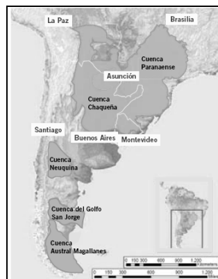
Figura 1. Cuencas con potencial Shale Gas en Sudamérica. (Advanced Resour. Internat. 2013)

Si bien estas presunciones son alentadoras, aunque muy preliminares respecto a un gran potencial, hay más 100 pozos realizados a la fecha.