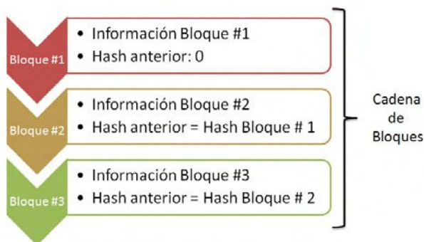
Figura 1: Comportamiento de una Cadena de Bloques.

La cadena se refiere a un hash que enlaza un bloque con otro, un hash es un algoritmo que transforma o resume el contenido del bloque en una salida [4]. Su principal uso es para la protección de los datos, mediante el ocultamiento o disfraz de los mismos con el propósito de que éstos no puedan ser alterados ni eliminados. Estos enlaces creados por la función hash permiten crear la fuerte cadena de todos los bloques, que ahora se encuentra encadenados entre sí y cuya misma función permite asegurar los datos que pasan de un bloque a otro. [3]. La siguiente figura muestra el comportamiento de una cadena de bloques.