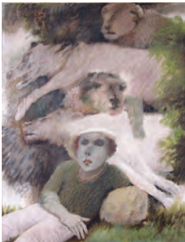
Símbolos y metáforas , óleo sobre tela, 170x130 cm.

Estas dos entidades – el Centro Bellarmino y la Pontificia Universidad Católica de Chile- se desarrollaron en un marco más general de creación de centros de investigación económico- sociales que fueron patrocinados por organismos dependientes de Naciones Unidas, la Organización de Estados Americanos, y/o respaldados por agencias gubernamentales de cooperación (principalmente de Estados Unidos) y la Iglesia Católica. Buena parte de ellos se instaló en Chile, en gran medida porque allí estaba la Comisión Económica para América Latina (CEPAL) desde 1948. Además de las oficinas regionales de UNESCO y FAO, se instalaron otros centros como la Facultad Latinoamericana de Ciencias Sociales, FLACSO (1957), la Escuela de Estudios Económicos Latinoamericanos (ESCOLATINA, 1956) y el Centro para el Desarrollo Económico- Social de América Latina (DESAL, 1960), entre otros (Bayle,