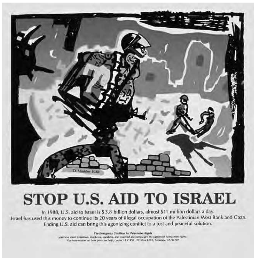
■ Dentente U.S. ayuda a Israel, 1988 | Doug Minkler

Los primeros usos de los dispositivos e Internet comienzan de la mano de padres y madres quienes introducen y acompañan a sus hijos/as en el mundo de las tecnologías. Allí se ofrecen las primeras habilitaciones como estar en contacto con familiares y amigas/os a través del whatsapp de sus padres o madres, sacarse fotos, mirar dibujos animados o películas on line , jugar videojuegos. En este punto, una dimensión complementaria al primer hallazgo que emerge con fuerza en los resultados es una clara división de género. En casi la totalidad de los casos son los padres quienes ofician como referentes para el aprendizaje, en tanto en el plano familiar se les percibe como las personas más diestras, mientras que son las madres quienes se ocupaban del cuidado y el control –directo o indirecto, manifiesto u oculto, pero siempre cotidiano– de lo que sucede en Internet.