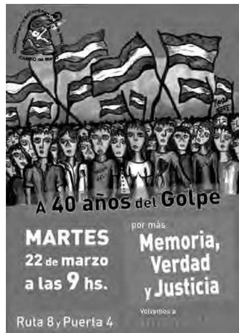
▪ Marcha por la Memoria, Verdad y Justicia, 2015 Comisión por la Recuperación de la Memoria de Campo de Mayo

En esta dimensión, un primer hallazgo se relaciona con la constatación de que, a pesar de las diferencias, la apropiación de las tecnologías constituye un eje central en torno al cual giran los vínculos entre adultos/as, niñas/os tanto en el hogar como en la escuela: habilitaciones, negociaciones y controles intergeneracionales se configuran en relación con los usos de Internet en general y las redes sociales en particular. El saber hacer facilita y, simultáneamente, tensiona estos vínculos.