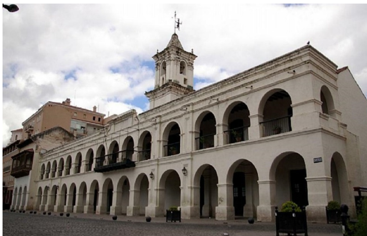
Figura 1. Vista general del Cabildo de Salta.

En la actualidad, el Museo Histórico del Norte es un complejo museístico conformado por el Cabildo de Salta, el Museo Nacional Presidente José Evaristo Uriburu y el Museo Posta de Yatasto, los cuales permanecen en actividad a los fines de representar la historia de la actual provincia salteña, tomando desde el período prehispánico, colonial y el período post-independentista. El Cabildo de Salta funciona como sede de dicho complejo y se localiza en el centro urbano de la ciudad, frente a la plaza principal (Fig. 1).