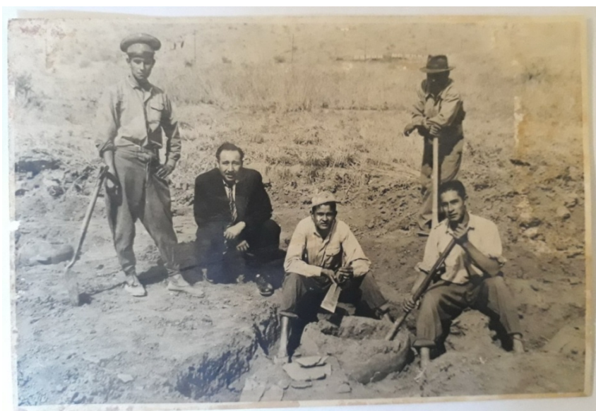
Figura 2. Rescate en El Portezuelo, Salta.