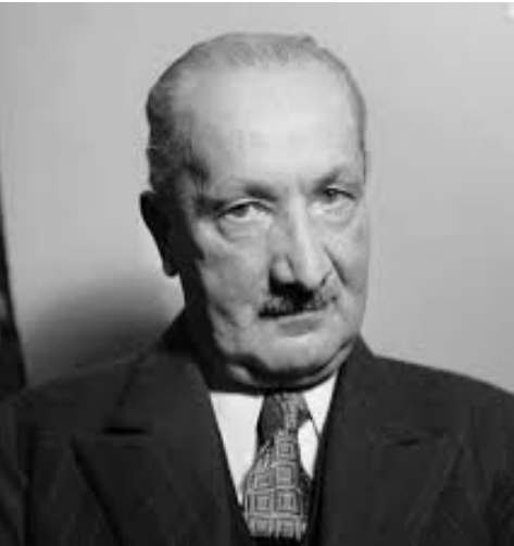
Martín Heidegger (1889- 1976)

Entre los años 1933 y 1934 Heidegger se dedica minuciosamente a comentar el libro El trabajador . Es importante ese dato por el hecho de que Heidegger se mueve en las alturas de la filosofía, pues solo comenta los grandes clásicos de la filosofía y prácticamente no comenta las obras de sus contemporáneos. Sin embargo, la única obra contemporánea a la que Heidegger dedica un seminario –que fue prohibido, pero del cual quedan las notas– es El trabajador .