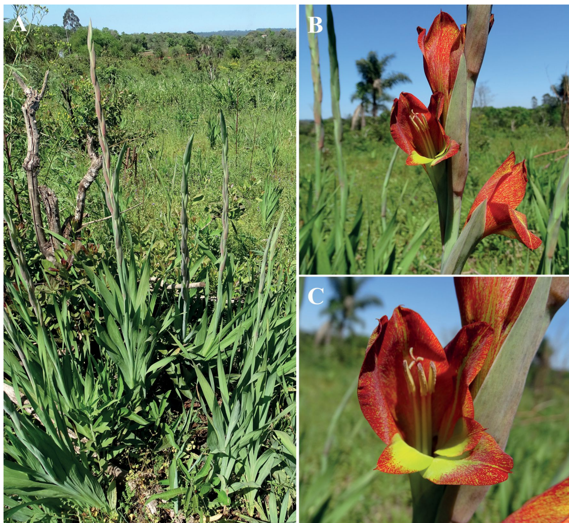
Fig. 1. Gladiolus dalenii . Plantas naturalizadas en Misiones. A: Plantas con espigas en desarrollo. B: Detalle de flores en la espiga. C: Detalle de la flor.