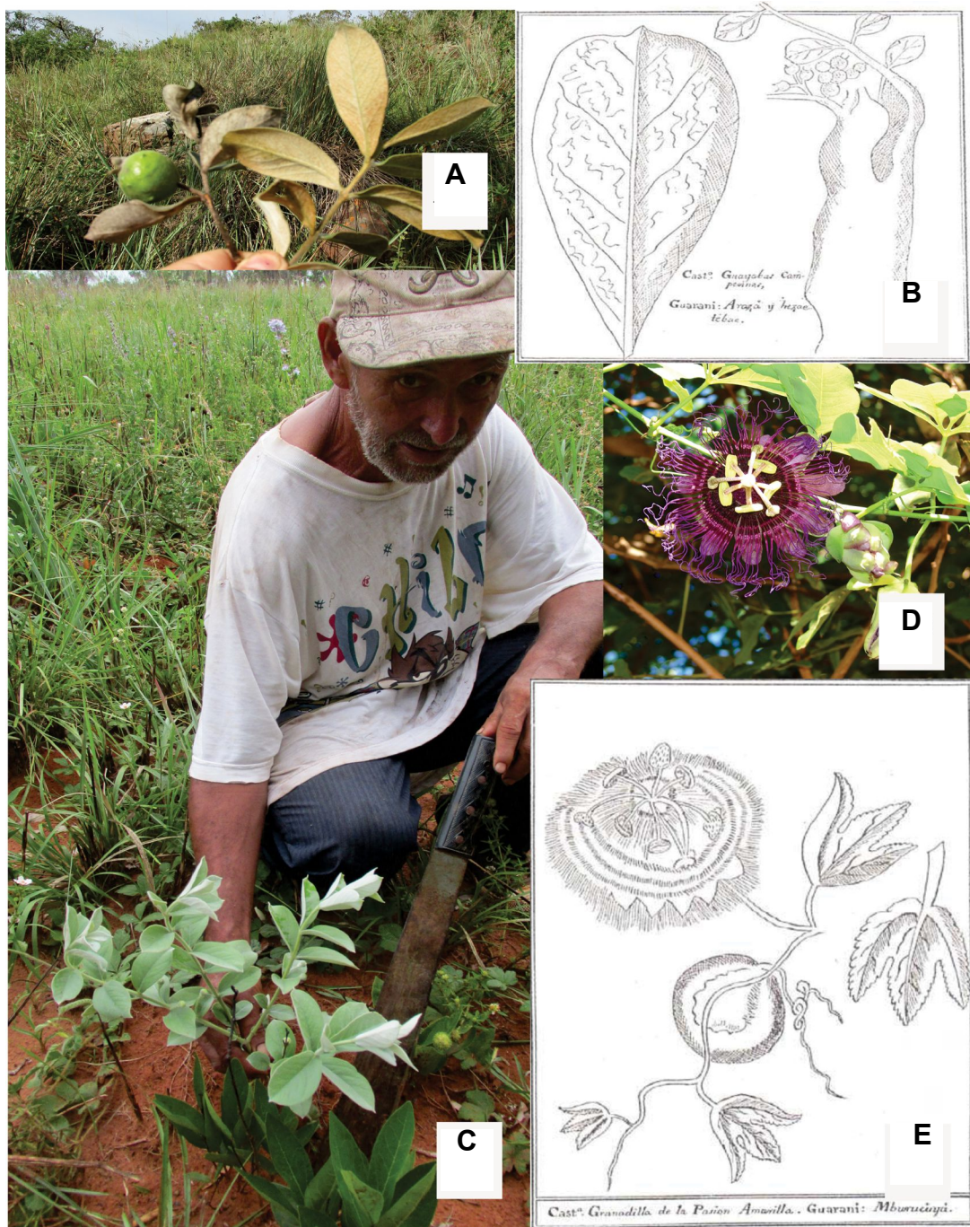
Fig. 3. “Granadilla” o “mburucuyá” ( Passiflora cincinnata ) y “guayabas campesinas” ( Psidium salutare ). A: Aspecto de la planta de “guayaba campesina”. B: Esquema de las plantas de guayaba campesinas. C: Aspecto de la planta de “guayaba campesina”. D: Aspecto de la flor y ramas con hojas de “mburucuyá”. E: Esquema de las plantas de “mburucuyá”. Créditos: A, C, D, Fotos H. Keller; B, E, Tomados de Montenegro.