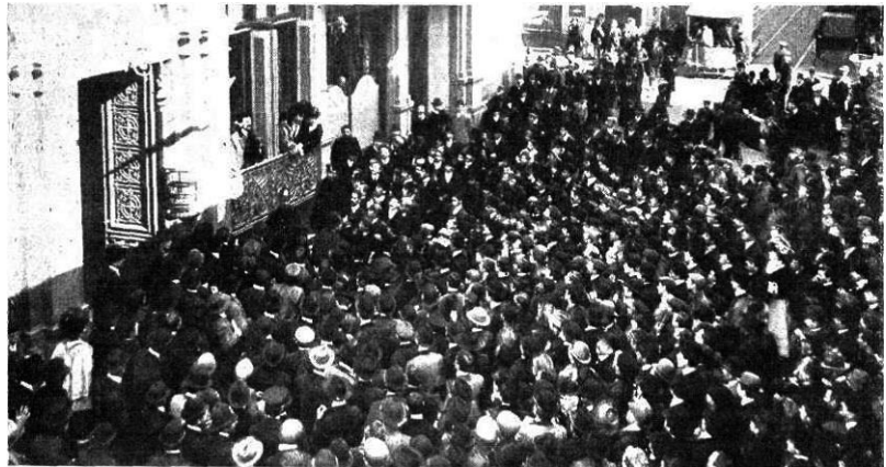
Figura 2: Guglielmo Ferrero y Gina Lombroso en el Royal Hotel.