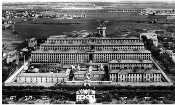
Figura 4: Prisión de Fresnes.