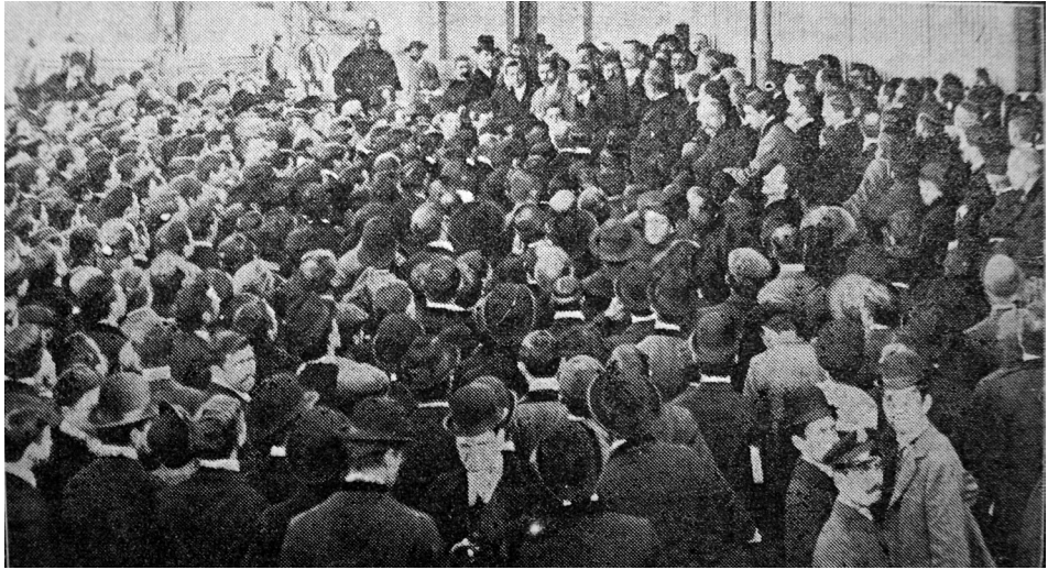
Figura 1: Llegada de Guglielmo Ferrero y Gina Lombroso al puerto de Buenos Aires.