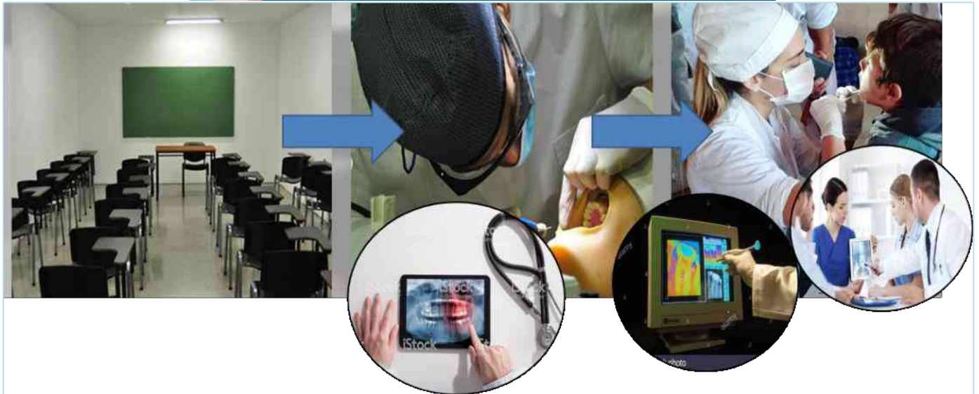
Ilustración 3. En esta imagen se incluyen burbujas que representan la inclusión de momentos durante las prácticas (ya sea con fantasmas o pacientes) donde a través del uso de recursos visuales se incluyan momentos de recuperación de contenidos teóricos visuales. Aprovechando la expansión de la accesibilidad de la tecnología, sabiendo que en cada clínica casi cada alumno podría contar con un propio recurso visual (teléfonos móviles) convirtiendo este elemento en un ayudante del proceso de enseñanza/aprendizaje.