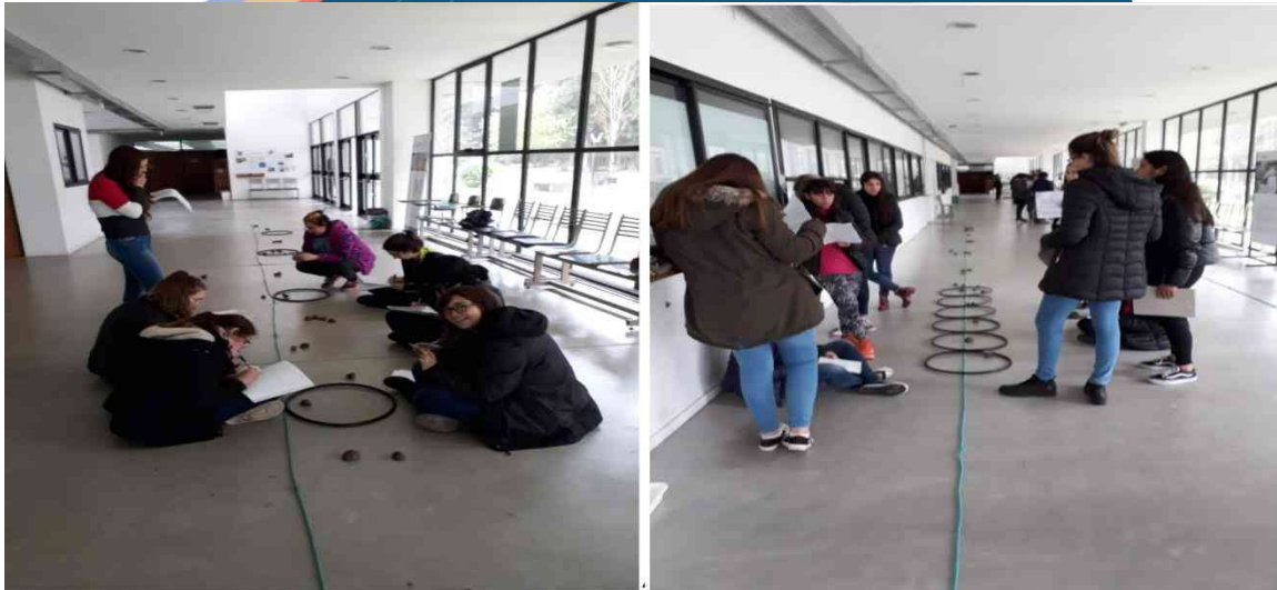
Figura2: Simulación de muestreo en Facultad de Humanidades y Ciencias de la Educación.

Al mismo tiempo, se discutió con los grupos sobre esta metodología de trabajo como estrategia de enseñanza de la Ecología. El eje de discusión versó sobre las ventajas y desventajas de replicar este trabajo en el patio de la escuela o cualquier ambiente extra áulico. En este sentido, la secuencia de actividades planteada implicó trabajar y problematizar la importancia de articular un tema que se pretende enseñar con el trabajo en un espacio diferente al del aula, motivado por la relación entre la resolución de un problema, el conocimiento previo de los estudiantes y las habilidades que se espera desarrollar a través del despliegue de este tipo de estrategias didácticas.