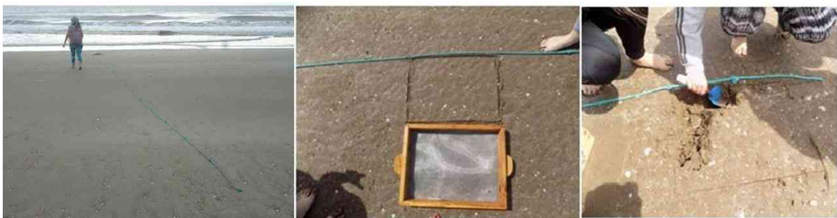
Figura 3: Muestreo de Amarilladesma mactroides

Las actividades desarrolladas en esta etapa, partieron del reconocimiento del lugar y de la reflexión sobre la importancia de las actividades planteadas en el trabajo de campo. En este sentido, se invitó a los estudiantes a preguntarse: ¿Qué elementos se deberían tener en cuenta para realizar un análisis de una población de organismos? ¿Por qué? ¿Con qué elementos se cuenta para poder realizar estas actividades? Una vez socializadas las respuestas, se procedió a delimitar la zona muestrear y a realizar las actividades correspondientes. La primera actividad consistió en el muestreo de almeja amarilla ( Amarilladesma mactroides ) en playas de San Clemente del Tuyú. La actividad comenzó con la determinación de la ubicación geográfica mediante un GPS y el reconocimiento del lugar; asimismo se delimitó la zona de muestreo, y se realizó una descripción del ambiente. Luego, se procedió a tomar variables ambientales (factores abióticos) en la estación de trabajo. Una vez realizado el registro de estos datos, se continuó con el muestreo de almejas, para lo cual se ubicaron sogas perpendiculares a la línea de costa, que actuaban como transectas (Figura 3).