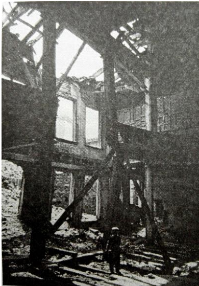
Figura N° 2 Paisaje de la amargura.

“Para comprender los orígenes de la profunda amargura que despertaba en mí el Estambul de mi infancia hay que acudir por un lado a la Historia a los resultados del desplome del imperio otomano, y por otro a la manera en que se ha reflejado en los hermosos paisajes de la ciudad y en su gente (...) es un sentimiento que se considera tanto negativo como positivo” (Pamuk, 2006:112).