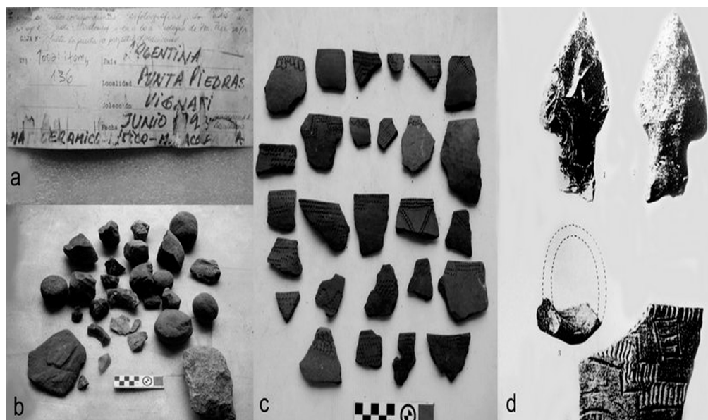
Figura 5. Colección de la MLP-Ar, conjunto dudosamente asignado al material obtenido por M. A. Vignati en Punta Piedras; (a) rótulo del conjunto; (b) material lítico; (c) fragmentos cerámicos; (d) material presentado en Vignati (1931: Lámina VIII) y ausente en el conjunto relevado.

El estado actual de los conjuntos analizados evidencia el tratamiento que tuvieron a lo largo del tiempo y por lo tanto su valoración en el marco institucional. Si bien el vigente proceso de puesta en valor de los depósitos de la MLP-Ar implica cambios significativos en las