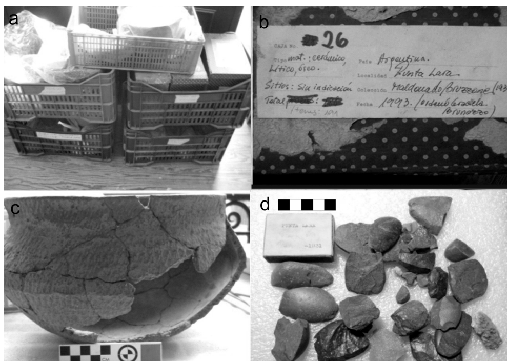
Figura 3. Colección R. Maldonado Bruzzone (MLP-Ar), material procedente de Punta Lara; (a) cajones contenedores en el D7; (b) caja rotulada; (c) pieza cerámica reconstruida; (d) conjunto lítico correspondiente a la colección hallado en el D25.

Por otro lado, una bolsa de 28 líticos hallada en el D25 pudo identificarse por el año y lugar que figuraban en una caja de fósforos que acompañaba al material: Punta Lara 1931 (Figura 3-d). Debido a la referencia a materiales líticos recuperados presente en la publicación se considera su pertenencia a esta colección,