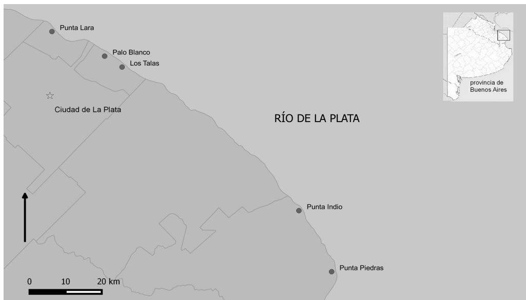
Figura 1. Litoral rioplatense en su sector correspondiente al curso medio del Río de La Plata, provincia de Buenos Aires (Argentina). Ubicación de las localidades donde se han obtenido los conjuntos arqueológicos abordados.

grupos en la zona y su vinculación temporal con otras ocupaciones cerámicas (Maldonado Bruzzone 1931; Vignati 1931, 1935, 1942, 1960; Cigliano 1963, 1966a; Cigliano et al. 1971; Ceruti y Crowder 1973; Austral 1977; Brunazzo 1999; Balesta et al. 1997; Pérez Meroni y Paleo 1999). También se ha registrado en la zona la presencia de poblaciones indígenas en momentos poscontacto; sitios indígenas con restos de fauna introducida (Pérez Meroni y Paleo 1996; Paleo y Pérez Meroni 2000) y materiales culturales de origen europeo (Austral 1977). Sin embargo, en otros casos, asociaciones similares se han considerado dudosas (Ceruti y Crowder 1973) o vinculadas a secuencias estratigráficas alteradas (Salemme et al. 1989). En su mayoría, tales registros no cuentan con fechados radiométricos; las escasas dataciones ubican estos materiales dentro de los últimos 2000 años (Pérez Meroni y Paleo 1996, 1999; Balesta et al. 1997; Brunazzo 1997; Paleo y Pérez Meroni 2000, 2004, 2005/2006, 2007). Otras dataciones efectuadas por Cigliano (1966a, 1966b; Cigliano et al. 1971) brindan edades anteriores, vinculadas a los cordones