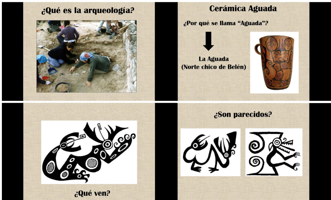
FIGURA 2 · Ejemplos de las diapositivas elaboradas y expuestas en la presentación.

des de La Plata y Belén, lo que nos permitió graficar el viaje que habíamos realizado y el camino recorrido para llegar hasta allí.