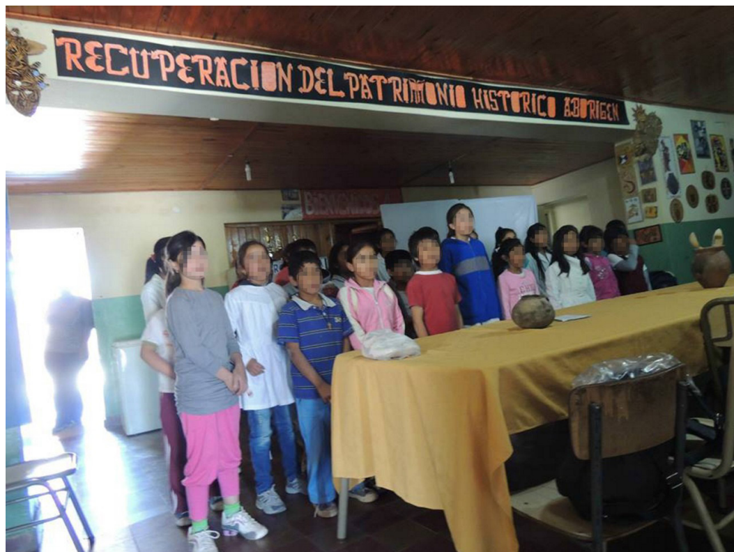
FIGURA 3 - Escuela N° 484 de La Estancia.

Esa mañana, al llegar a la escuela nos sorprendió un cartel en el que se leía: Recuperación del patrimonio histórico aborígen (Figura 3), debido a que en las discusiones previas acerca de cómo presentar la temática del patrimonio de una manera simple, y siendo conscientes de la complejidad del concepto, presuponíamos que resultaría una tarea difícil. Sin embargo, a través del cartel pudimos notar rápidamente que esta cuestión se encontraba abordada en la escuela, lo cual nos hizo sentirnos más seguros a la hora de comenzar a hablar sobre el tema.