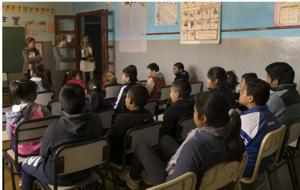
FIGURA 4 • Introducción a la charla en la escuela de La Ciénaga de Arriba.

es Argentina, restándole importancia a los grupos locales que habitaron en la zona de la actual Catamarca.