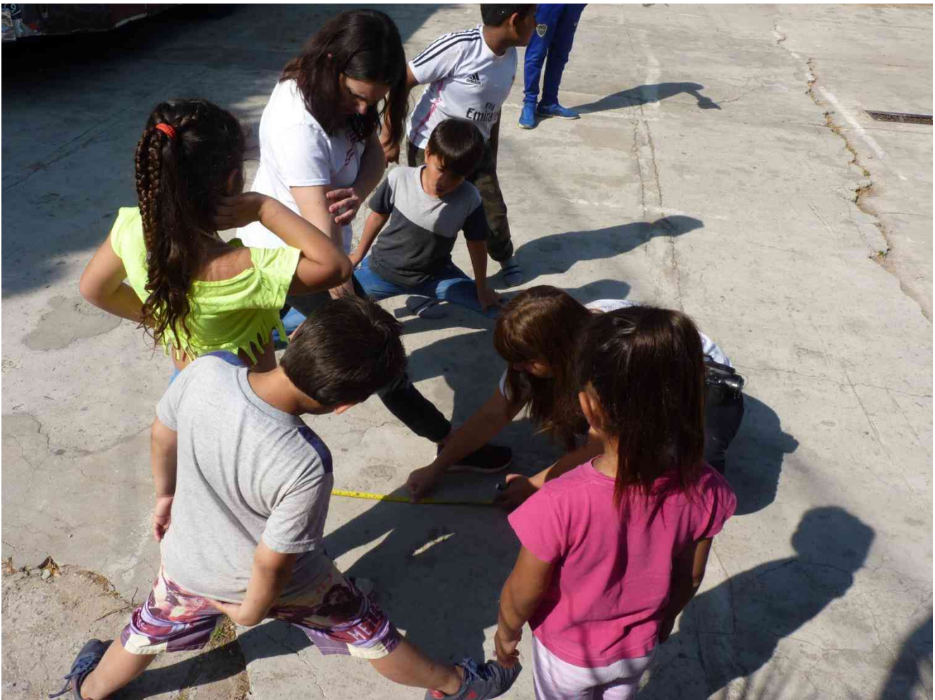
Ilustración 3. Taller ArKidtectando.

En los últimos años la Universidad Nacional de La Plata y la Facultad de Arquitectura y Urbanismo han trabajado significativamente en las actividades de extensión generando programas y subsidiando los mismos por la UNLP y otros por la FAU. De esta manera, reconociendo la mayor dedicación docente para las actividades extensionistas, impone generar políticas de formación y capacitación que permita construir programas de mediano y largo plazo. Promover y jerarquizar las actividades de extensión a fin de favorecer el desarrollo de la agenda de la Universidad Pública