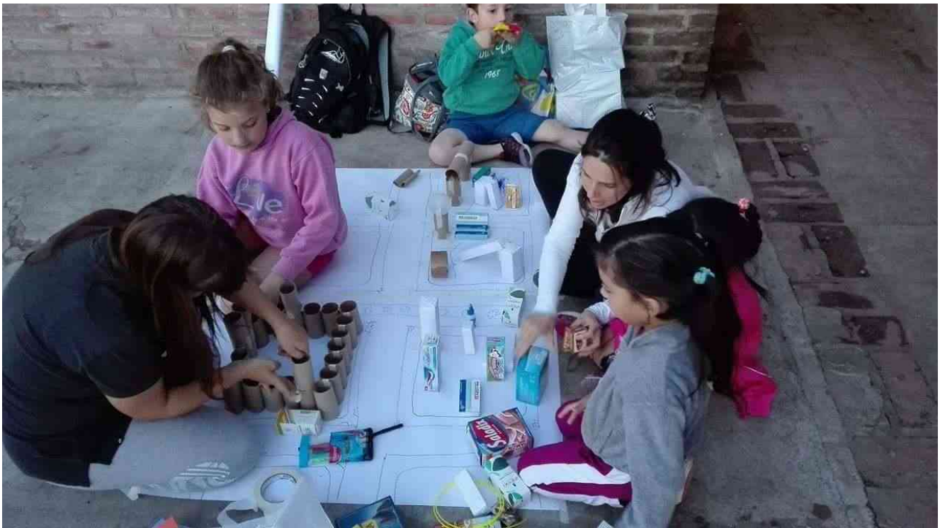
Ilustración 2. Taller El Hornero Urbano.

“El hornero Urbano”, busca la integración social y el aprendizaje de valores sociales como el esfuerzo personal, el trabajo en grupo, recuperando el derecho a la ciudad y construyendo una dimensión pública de la arquitectura. Estudiamos, construimos, reconstruimos y decodificamos la ciudad.