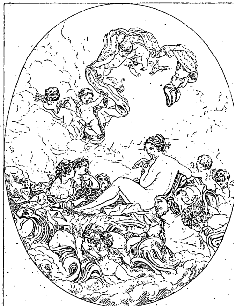
g. 367. — La naissance de Vénus (d'après un tableau de Boucher).

La siguiente particularización del enigma es la identificación con el misterio del eterno femenino (Giordano 1979: 152). 12 Esta intervención se inicia con Neso quien, según el mito, rapta a Deyanira; el intertexto cultural asienta caracterizaciones generales de lo femenino que se resemantiza, además, conjugando las imágenes finiseculares de femme angelical (“claridad de estrella”) y femme fatal (introducida con imágenes olfativas que remiten a la pulsión sexual, a lo animal: “Mi espalda aún guarda el dulce perfume de la bella”; “¡Oh aroma de su sexo!”). Ambos tópicos confluyen hacia el final de la estrofa por la conjunción sintáctica: (“¡Oh rosas y alabastros! / ¡Oh envidia de las flores y celos de los astros!”) pues con “perfume” se retoma lo erótico consolidado por “rosas”, símbolo del erotismo desde el prerrafaelismo (Bornay 2004 [1990]: 161) y con “astros” —repetido en eco en “alabastros”— se trae el vínculo con lo “angelical”. La culminación de este tratamiento se presenta en la descripción del nacimiento de Venus. La operación se concreta en un pasado indefinido y rotundo (“nació”). Los versos, entonces, se instalan en la concepción órfica de Eros , pues “Venus” también es la fuerza que sostiene la