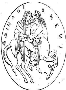
Fig. 615. — Enlèvement de Déjanire (d'après un miroir étrusque).

La aparición de estos retratos anticipa la de Prosas profanas y “encarna la necesidad de estar al día” (Ghiano 1968: 21); tildado de “decadente” y “novedoso” por Paul Groussac en su reseña, 20 no es extraño que el poeta nicaragüense le dedicara el “Coloquio de los centauros” que justamente transfigura la decadencia del centauro de los subtextos franceses —vejez, agonía— en el vigor y exaltación pánicos (Darío 1976 [1909]: 168) sobre un sustrato metafísico, sostén de un ideal poético. Tanto la publicación del libro como manifiesto encubierto y esta dedicatoria indican otra regla del ceremonial del protocolo intelectual en un intento por ubicarse en el campo intelectual porteño.