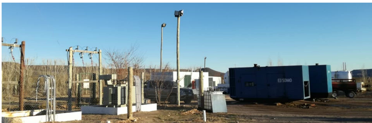
Figura 3: Usina eléctrica de Telsen, gentileza de la Sra. Mariela Curaqueo.

Para una primera estimación del potencial de la energía solar en estas latitudes se evaluó técnica y económicamente una planta solar fotovoltaica de 100 kW. En las siguientes secciones se muestran los resultados obtenidos.