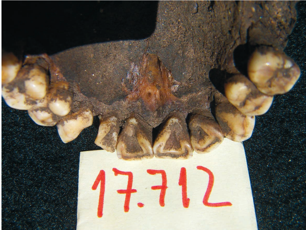
Fig. 3. Dentición superior del individuo 17.712.