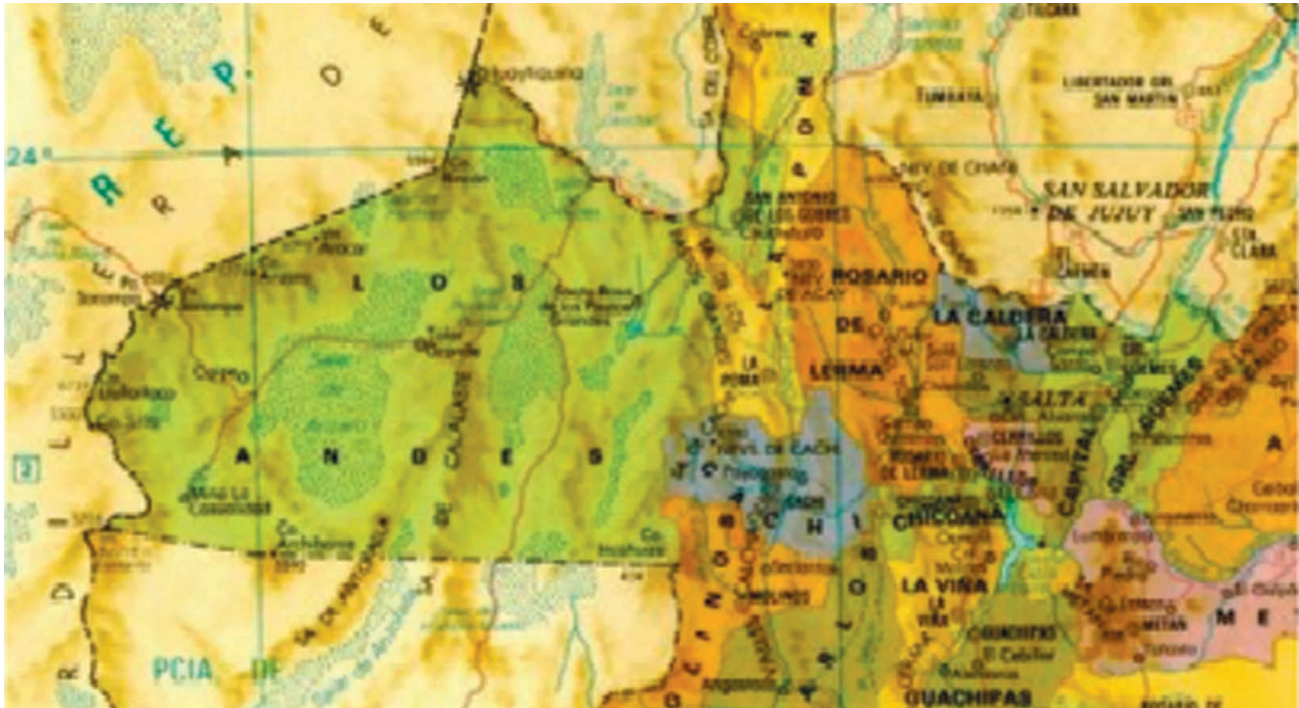
Fig. 1. Localización del Departamento de Guanchipas en la provincia de Salta.

capayanes en el sur, grupos que tenían, entre sus características comunes, el uso de la lengua cacán o diaguita. Fueron los más avanzados entre los grupos que poblaron el territorio argentino y ello se debió fundamentalmente, a la poderosa influencia incaica.