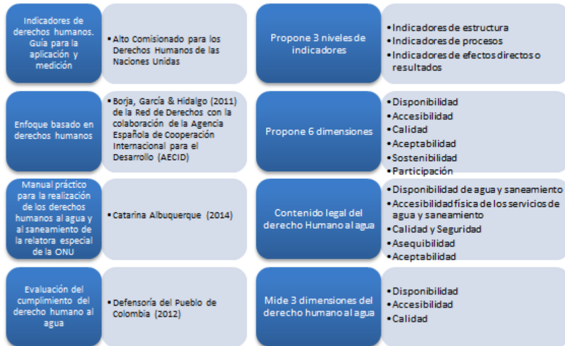
Tabla 1. Medición de Derechos humanos

Fuente: Alto comisionado para los Derechos Humanos de las Naciones Unidas, Borja, García & Hidalgo (2011), Albuquerque (2014), Defensoría del Pueblo de Colombia (2012).