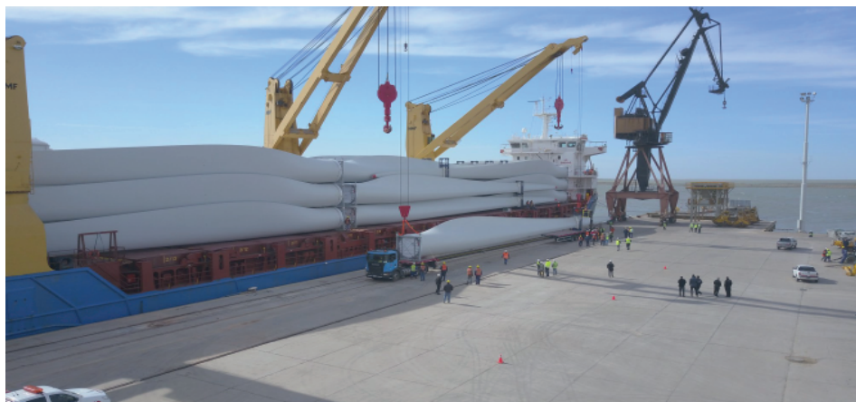
Figura 2. Recepción de las aspas de los aerogeneradores en el muelle multipropósito del Puerto Ingeniero White, octubre 2017.