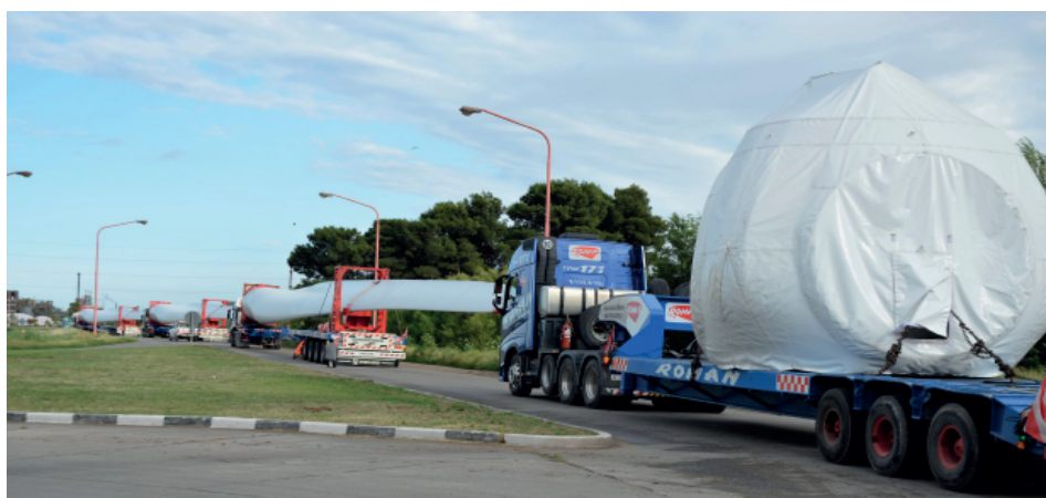
Figura 3. Operativo de traslado de equipamiento eólico por Ruta Nacional 3, noviembre 2017.

La existencia de infraestructura vial y portuaria y el buen acceso a redes de conexión eléctrica repercuten de manera favorable no solo en la logística que implica la construcción de los parques eólicos, sino también haciendo factible y más económica la inyección de la nueva energía generada. El análisis de estas tres condiciones presentes en la región SUBA permite identificar una sinergia 12 entre potencial eólico, localización e infraestructura y servicios, la cual se fortalece por la impronta o trayectoria del sur bonaerense a través de experiencias eólicas pioneras.