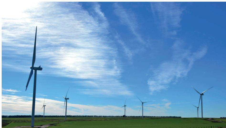
Figura 5. Parque eólico Corti, Bahía Blanca.

La mayoría de los proyectos eólicos de la región SUBA, tras la firma de los contratos con la Compañía Administradora del Mercado Mayorista Eléctrico (CMMESA), han iniciado las tareas de construcción, aunque presentan distinto estado de avance. El 23 de mayo del 2018, el parque eólico Corti 14 se convirtió en el primero del RenovAR en inaugurarse. Localizado sobre 1.560 hectáreas rurales a la vera de la Ruta Provincial 51, a 20 kilómetros al noreste de Bahía Blanca, el parque cuenta con 29 aerogeneradores con una capacidad de producción de 100 MW (Fig. 5).