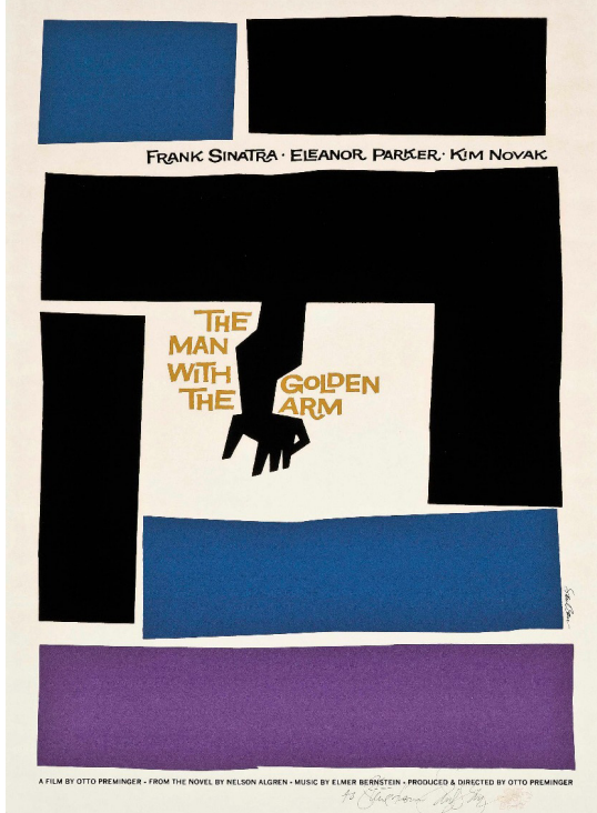
Figura 4. Cartel realizado por Saul Bass para El hombre del brazo de oro (1955)