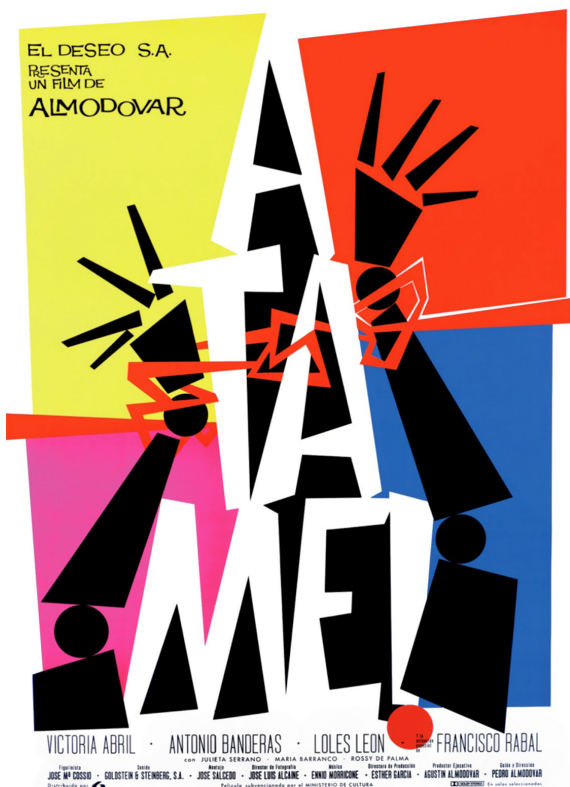
Figura 3. Cartel de Juan Gatti para la película ¡Átame! (1990), de Pedro Almodóvar

El autor Andreas Huyssen (en Casullo, 1996) reflexiona acerca de si en este contexto se producen «formas estéticas realmente nuevas o si sólo recicla técnicas y estrategias del mismo modernismo, reinscribiéndolas en un contexto cultural diferente» (p. 270). Gatti recurre a reciclar estilos de la modernidad para revitalizar la imagen de un cantante pop; ofrece, de esta manera, un impacto visual digno de ser objeto de deseo debido a su extrañamiento y rechaza el uso de una propuesta convencional con meros motivos comerciales donde solo se reconozca y admire de forma explícita y directa la figura del cantante. Podemos, entonces, reconocer en el trabajo del diseñador, una necesidad por crear imágenes capaces de generar una afección al ser contempladas, existe la presencia de la búsqueda por conseguir un plus diferencial en sus propuestas visuales.