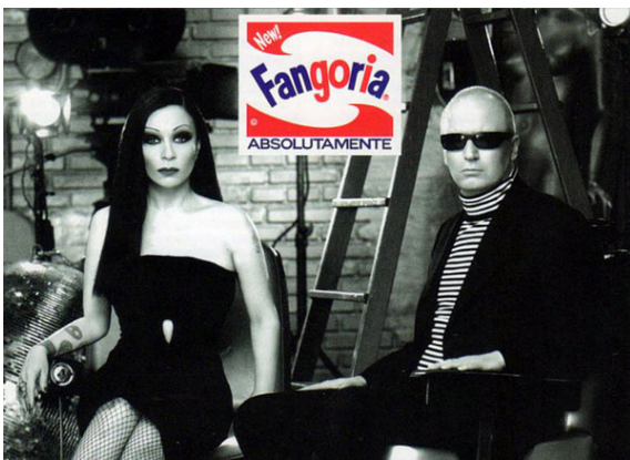
Figura 5. Arte de Tapa realizada por Juan Gatti para el disco Absolutamente (2009), de Fangoria

7. Fangoria es un dúo de música pop formado en Madrid en el año 1989, su cantante conocida como Alaska describe la diversidad de encargos solicitados a Gatti (en AA.VV., 2012) a lo largo de su carrera artística de la siguiente manera: «Juan algo en un blanco y negro underground, y reinventa el mundo warholiano de la Factory; Juan espectáculo de revista musical de La Latina, y te saca como a la mejor-peor vedette; Juan, ¿Un video con Sara Montiel? Y concibe un universo Supersara; Juan, una campaña para PETA, y consigue mezclar sangre, pin-up, gore y glamour».