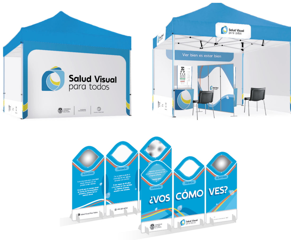
Figura 5. Propuesta para intervenciones eventuales: gazebo de atención y paneles inmersivo-interactivos

Para eventos especiales en fechas específicas, como el Día Mundial de la Visión o el Día Mundial de la Salud Visual, en los que el equipo de «Salud visual para todos» pueda realizar eventos en espacios abiertos, o para aquellas ocasiones en las que se lleven a cabo intervenciones territoriales, fueron diseñadas piezas que permiten promocionar el programa y profesionalizar la atención óptica y optométrica en las intervenciones programadas. Se proponen: un gazebo, stands para exámenes visuales, un biombo para facilitar el desarrollo de la actividad y un conjunto de paneles inmersivo-interactivos que contrastan zonas de visión clara con zonas distorsionadas para que los usuarios puedan experimentar los riesgos y consecuencias de no hacerse controles visuales periódicos [Figura 5].