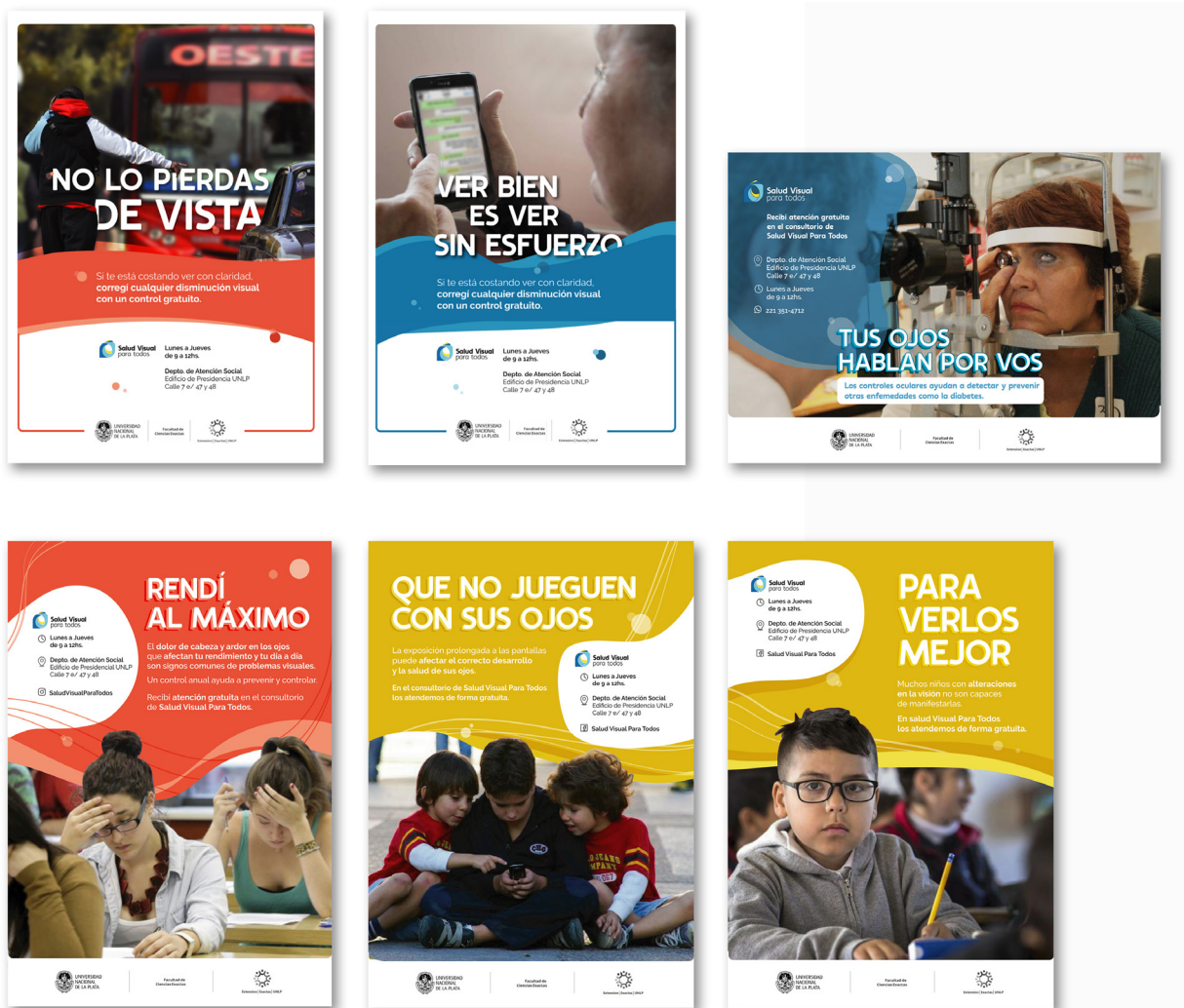
Figura 2. Algunos de los afiches para carteleras urbanas, universitarias, escolares y sanitarias

La estrategia de identificación logra evidenciarse en la fortaleza de los mensajes, difundidos por medio de afiches impresos en la vía pública, a emplazarse en paradas de colectivos de distintos puntos de la ciudad de La Plata, afiches impresos en carteleras ubicadas en centros de atención primaria y afiches para carteleras universitarias y escolares [Figura 2]. En ellos se representan los hábitos cotidianos que resultan dañinos para la salud visual. La segmentación en los tres subgrupos anteriormente mencionados se enfatiza con una segmentación cromática según el público objetivo.