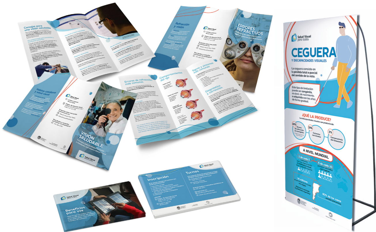
Figura 4. Folletos trípticos, volantes e infografía

Además de las piezas específicas, pensadas para la particular necesidad de cada subgrupo, se desarrollaron piezas gráficas de capacitación y eventuales, destinadas a la totalidad del público objetivo. Se trata de volantes informativos, folletos trípticos educativos y un banner infográfico de capacitación [Figura 4], cuya implementación no varía a pesar de las diferencias entre cada subgrupo descrito.