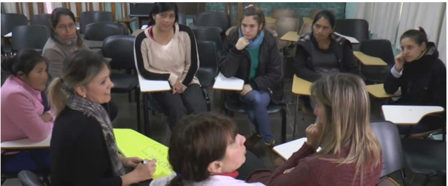
Figura 2. Actividad en ronda: disposición con la que se logra mayor interacción e intercambio de experiencias

Cuando nos encontramos antes situaciones de no comprensión, cuando sentimos que nuestras estrategias habituales no son interpeladoras o cuando nuestros vocabularios no alcanzan a explicar situacionalmente lo necesario es cuando aparece el diálogo freireano. La comunicación aparece en nuestras capacidades de comprender que estamos en presencia de diferentes, al hacer extensión muchas veces nos encontramos con dificultades de encuentro y reconocimiento de las diferencias y allí radica la complejidad del vínculo dialógico. Es necesario advertir que esas dificultades existen para nosotros, que intervenimos ajenos a las lógicas y prácticas culturales de esos espacios o colectivos con los que estamos interactuando (Quiroga, 2019, p. 107).