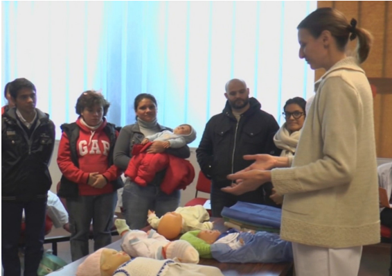
Figura 1. Actividad práctica con muñecas/os. Armado de niditos para el bebé en la incubadora