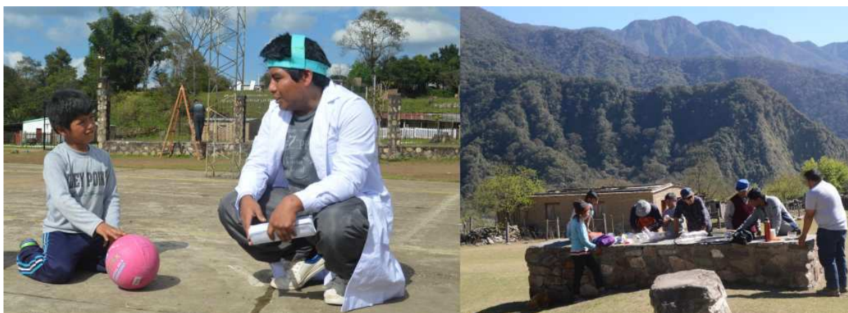
Figura 4: Los talleres El Dr. de la energía y Fuentes de energía y usos, en pleno desarrollo.