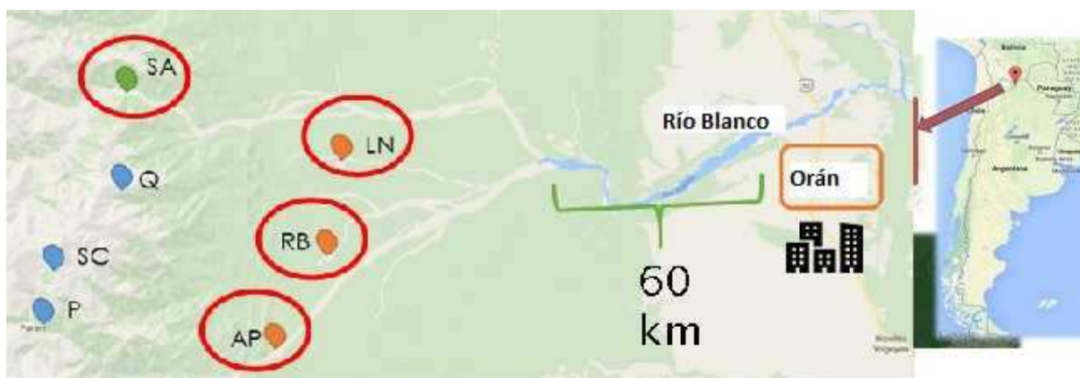
Figura 1: Ubicación de los cuatro pueblos de la Comunidad kolla Tinkunaku, en el Departamento de Orán, provincia de Salta.

La tarea educativa se articula mediante la reflexión y la acción. La reflexión se produce en torno a conceptos como territorio, naturaleza, energía, sustentabilidad, cambio climático y medioambiente. La acción se materializa mediante la ejecución de talleres ad – hoc organizados en cuatro pueblos de la Comunidad kolla Tinkunaku ubicados en Departamento de Orán, provincia de Salta: Angosto de Paraní, Río Blanco, San Andrés y Los Naranjos (Figura 1). En cada comunidad se concurre a las escuelas albergues primarias y secundarias, que funcionan en un mismo predio que irradian acciones de interés educativo y de políticas públicas.