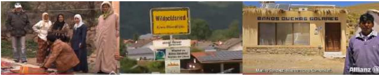
Figura 2: captura de pantalla de los videos referidos a aplicaciones de ER en Tajmud, Wildpoldsried y San Juan y Oros.

Una síntesis de los talleres dictados, de acuerdo a las edades de los destinatarios, los recursos utilizados y los asistentes se presenta en la Tabla 2.