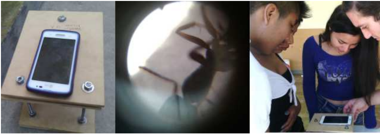
Figura 6: Microscopio de bajo costo construido en el taller de física y medición de su aumento.