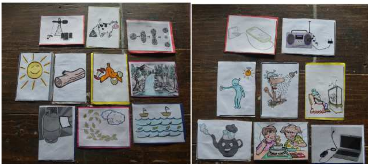
Figura 3: conjunto de tarjetas como material para usar en los talleres EduMAyE.

taller una vez que ya ha comenzado. Se estima que el número de asistentes por municipio varía entre los 5-6 de Los Naranjos a los más de 25 de Río Blanco.