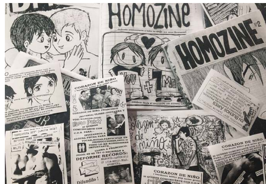
Figura 1. Colección de Fanzines. Programa de memorias políticas feministas y sexogénicas (CeDInCI)

que conservaron fotos eran aquellas que podían tener un departamento privado, un domicilio apenas más estable—. Y, también, por la vinculación afectiva con esos artefactos culturales: un gran ejemplo de esto son las revistas pornográficas. 2 Desde la creación del Programa, en el CeDInCI proliferaron las entradas a las discotecas, las figuras desnudas recortadas y coleccionadas en carpetas y otros objetos que levantaron el termómetro del centro, y ahuyentaron cualquier tipo de solemnidad institucional [Figura 2].