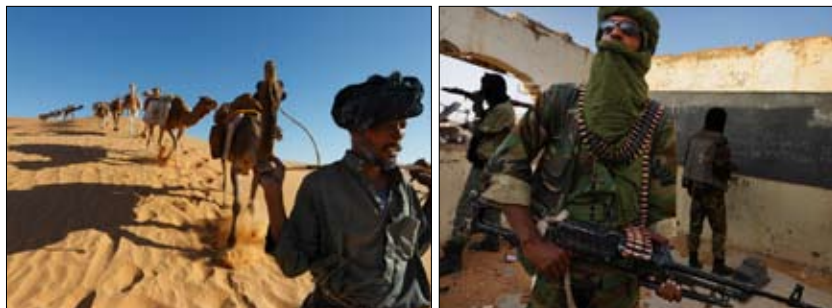
Figura 2: a la izquierda: caravaneros Tuareg. A la derecha: combatientes Tuareg