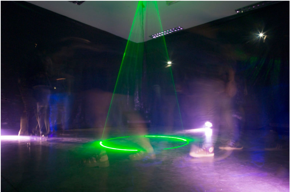
Imagen 1. Instalación en funcionamiento, usuarios en movimiento por el espacio.