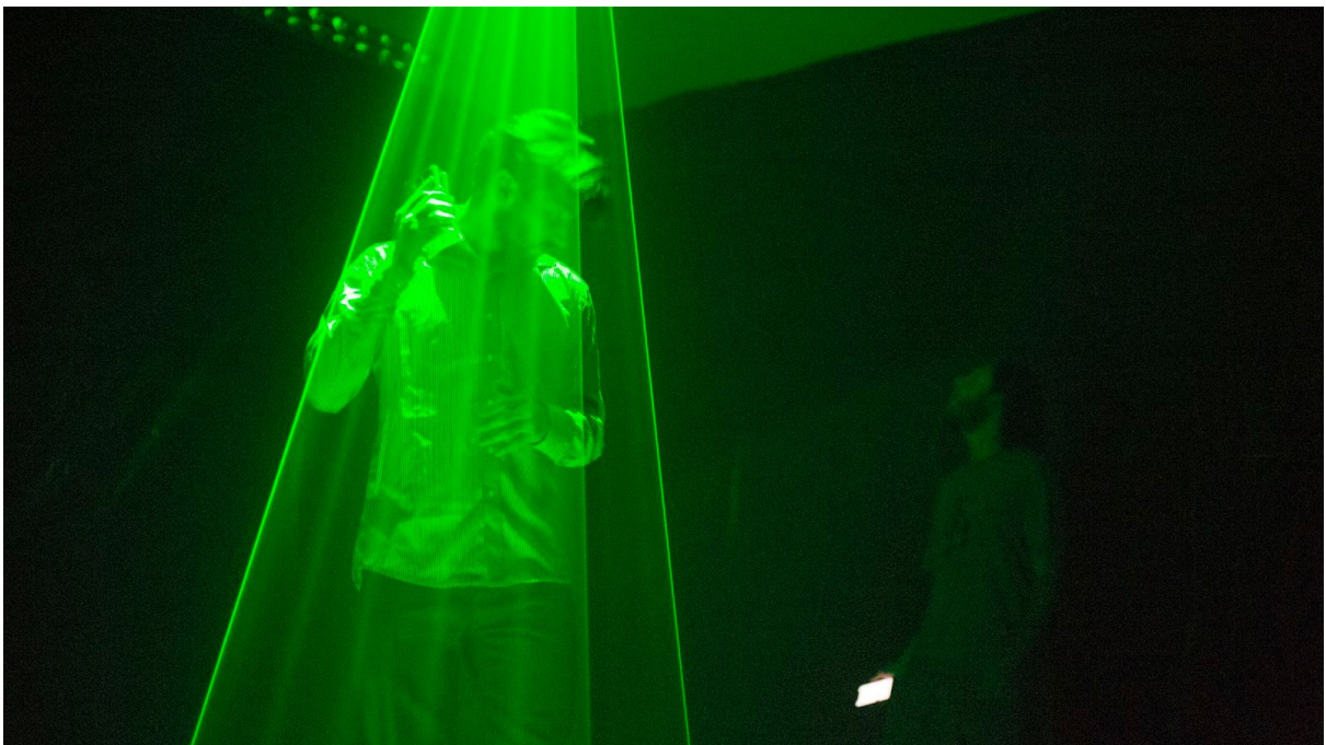
Imagen 2. Interactor agitando dispositivo celular bajo el cono dibujado con láser.