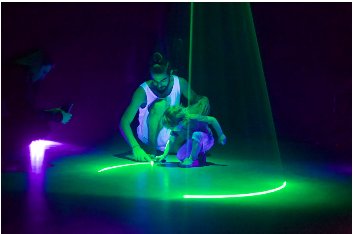
Imagen 4. Niño jugando con el haz del láser sobre el suelo.