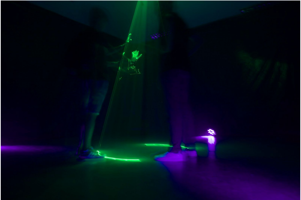
Imagen 3. Instalación en standby con luz ultravioleta, usuarios “tocando” la pared imaginaria.