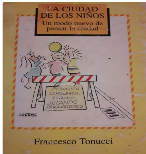
Imagen N° 1: Portada del libro La Ciudad de los Niños