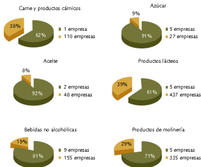
Censo económico: concentración de ventas en algunos productos, año 2010