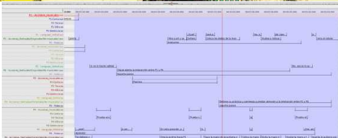
Figura 5. Captura de pantalla de las anotaciones en una escena de interacción basada en la resolución de un problema.